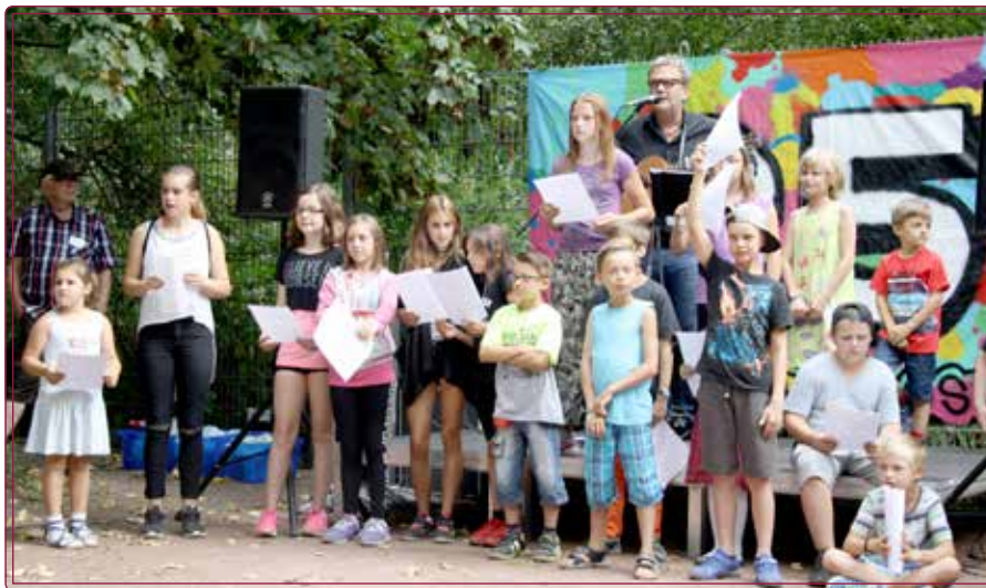
Kinder singen den KTK Song

Gute Laune wurde durch die Artisten von „Kugelchaos“ sowie durch das Team der Weißen Rose versprüht. Die kleinen und großen Gäste konnten diesen erlebnisreichen Jubeltag durch eine Fotoaktion festhalten lassen. Ein vielseitiges Kuchenbuffet stand bereit und verköstigte Jedermann.