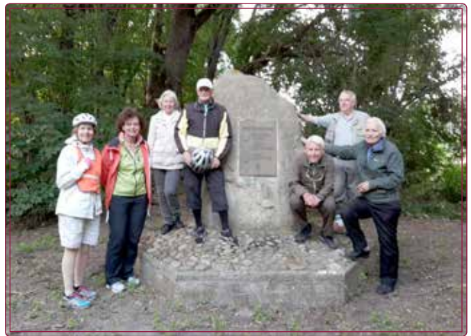
Einige von der Radlergruppe pausieren am "Dreiherren-Stein": BS-SZ-PE bei Groß Gleidingen