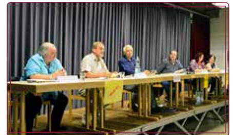
Zur Podiumsdiskussion am 6. Sept. 2016 erschienen 70 Interessenten