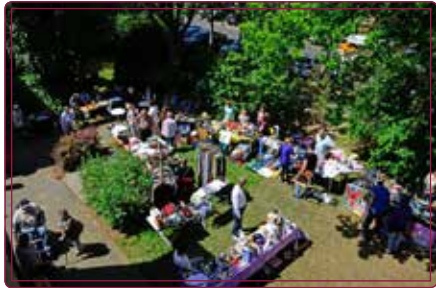
Flohmarkt Pregelstraße am 07.06.2015