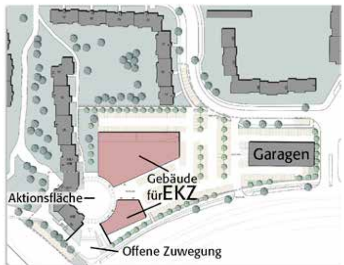
(Bildrechte Architekturbüro Kiepke + Neumann und ›Wiederaufbau‹)