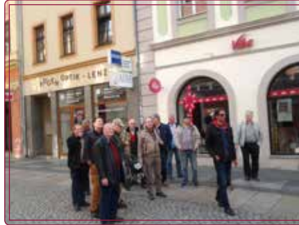
Männer auf Tour in Bautzen

begannen mit einem kleinen Gartengrill Bratwürste bei den öffentlichen Festen in der Weststadt anzubieten. Bald war der Gartengrill zu klein, und es musste ein größerer Gasgrill her. Die Männer mit ihrem Gasgrill sind sehr gefragt und sind bei allen wichtigen Festen dabei.