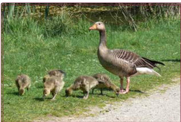
Eine Graugans mit ihren Küken am Raffteich