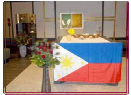
Gabenaltar mit dem Hauptnahrungsmittel Reis

Am Weltgebetstag solidarisieren sich Frauen aller Konfessionen in der Welt mit den Menschen.