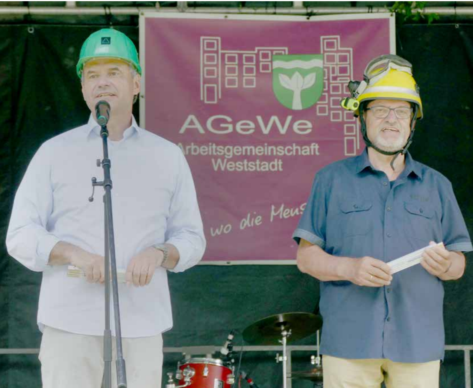
Launige Eröffnung des Sommerfestes durch OB Ulrich Markurth und Bezirksbürgermeister Ulrich Römer