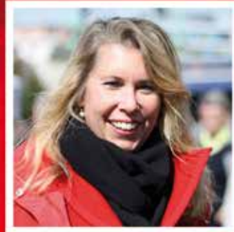
Annette Schütze Landtagsabgeordnete für Braunschweig-Süd