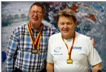
links: Martin Langer