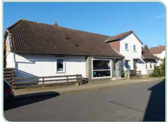
Bäckereiansicht aus Richtung Flughafen

Stadtteilheimatpfleger Waggum Heinz Georg Pentsch Am Steinring 33 Tel. 05307 6097 E-Mail: mhg.pentsch@onlinehome.de