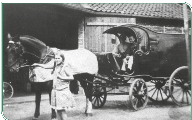
Auslieferungsfahrzeug für Backwaren. Im Vordergrund Gerda Reunig, geb. Diestelmann.