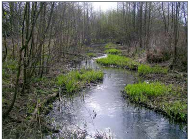
Renaturierter Abschnitt vor der A 391