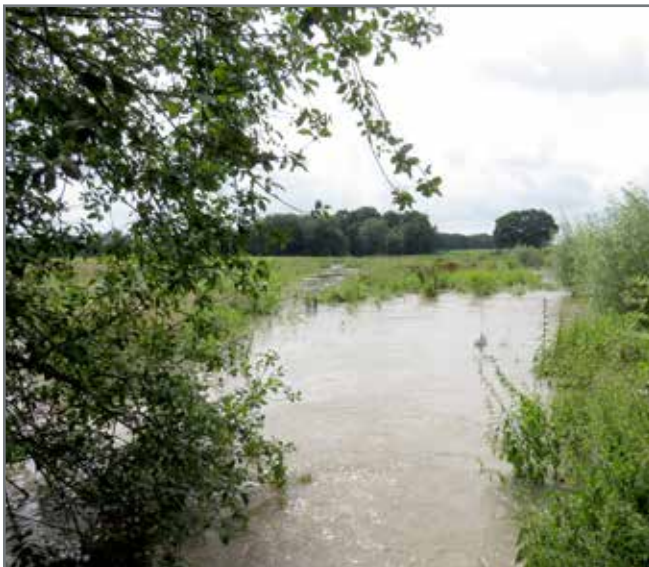
27.07.2017 Hochwasser am Bechtsbüttler Weg