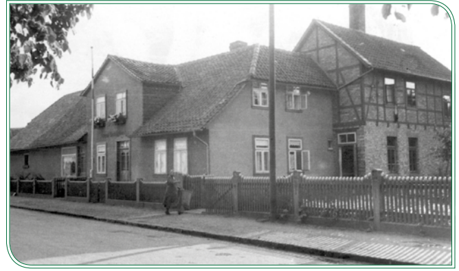
Die Bäckerei um 1950

August Diestelmann wurde 1935 bis zum Ende des 2. Weltkrieges 1945 zum Gemeinderatsmitglied bestimmt. Von 1948 bis