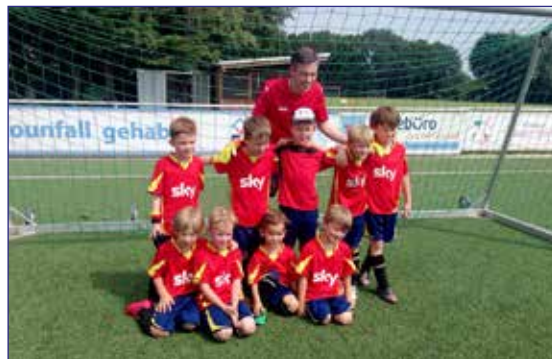
Abgekämpfte Kicker nach der letzten Spielrunde

In den Spielrunden der Freiluftsaison gab es Licht und Schatten. Nach einem guten Beginn, auch insbesondere gegen das starke Team aus Ölper, konnten wir erst wieder zum Saisonende überzeugen. Sicherlich war hier-für einerseits unser bei den Spielrunden etwas dünn besetzter Kader verantwortlich, andererseits natürlich auch die vorwiegend mit guten Spielern des älteren Jahrgangs bestückten gegnerischen Teams. Zu Saisonende hat es dann wieder deutlich besser funktioniert. Hier gilt es also weiter fleißig zu trainieren.