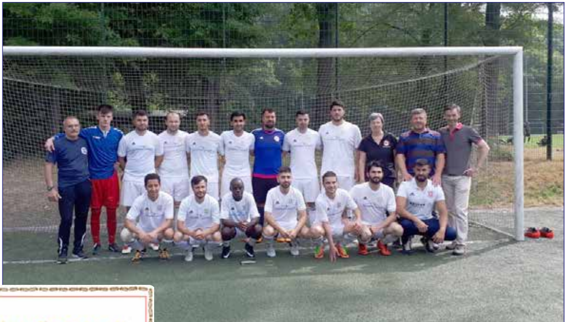
Teamfoto nach dem letzten Spieltag