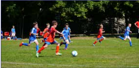
Spieldzene SCEII – Lehdorf III

Wie bereits im letzten Heft berichtet, ist die F-Junioren mit zwei Teams in der diesjährigen Freiluftsaison angetreten – der ältere 2009-Jahrgang als F1, der jüngere als F2. Trainiert wurde immer gemeinsam in einer großen Gruppe.