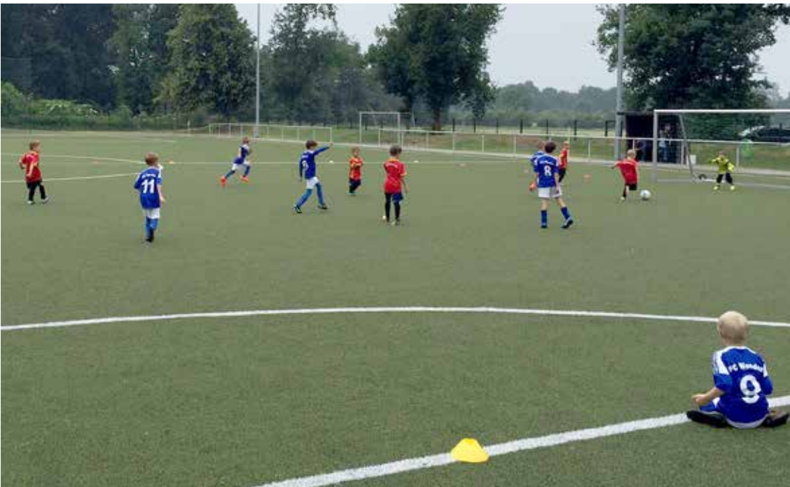
Und gleich fällt das Tor