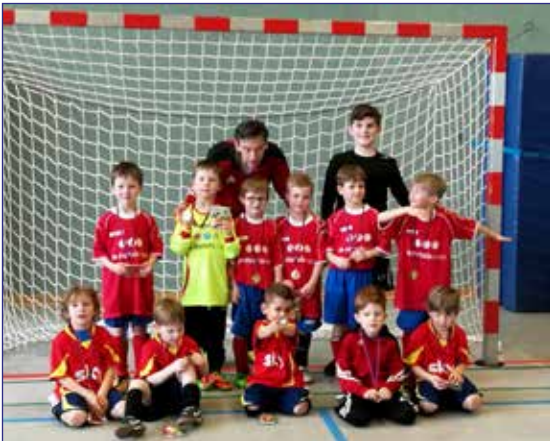
Unsere Teams nach der Medaillenübergabe

Abschluss der diesjährigen Hallenrunde bildete unser mittlerweile schon fast traditionelles Turnier in der Sporthalle des Ricarda-Huch-Gymnasiums. Neben zwei Teams unserer G-Junioren nahmen Mannschaften aus Weddel, Kralenriede, Melverode und Völkenrode teil. Den Kindern hat es wie immer viel Spaß bereitet. Vielen Dank an dieser Stelle noch mal allen Helfern.