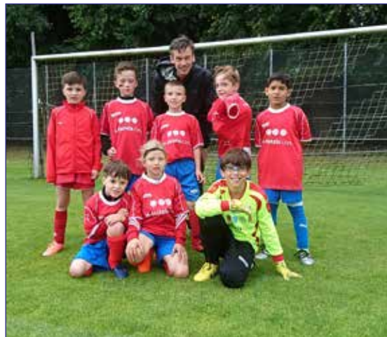
Team SCE/Rot-Weiß beim Sichtungsturnier