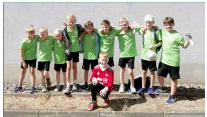
E-Jugend Turnier Schöppenstedt

Die neuformierte Mannschaft ließ von Beginn an keinen Zweifel daran, wer hier dieses toll organisierte Turnier gewinnen will. Unsere E-Jugendmannschaften konnten somit das dritte Mal in Folge den Eulenspiegelcup gewinnen und die Freude war riesengroß.