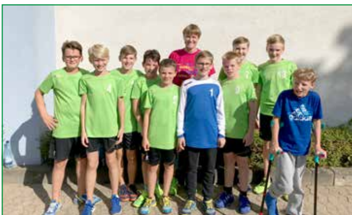
D-Jugend Turnier Thiede

Unsere D-Jugend spielte in der Vorbereitung das Turnier in Thiede auf dem Rasen als Abwechslung zum Trainingsalltag.