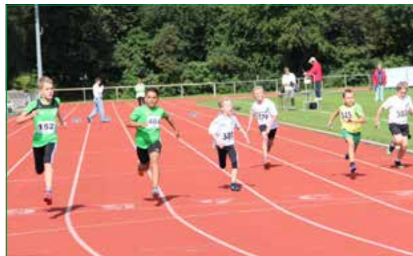
Mehrkampfmeisterschaften: Drei Mascheroder Leichtathleten im Starterfeld 50 m Lauf der Klasse M10