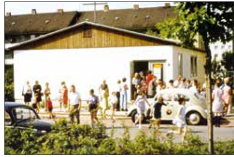
1969 Notkirche am Queckenberg

Sie haben noch Cyriakus-Bilder von früher? Bestimmt gibt es noch das eine oder andere Album oder einen Karton, in dem Bilder aufbewahrt werden. Zeitzeugen!