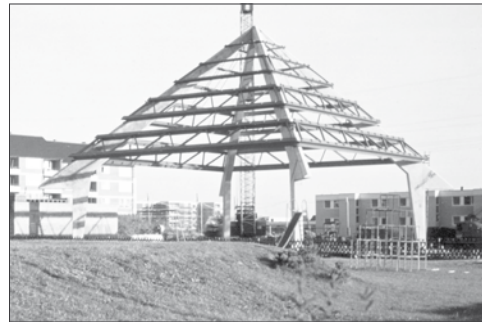
1971 Kirchneubau St. Cyriakus

Gerne würden wir diese Bilder der 60er, 70er, 80er Jahre und darüber hinaus wieder zum Leben erwecken.