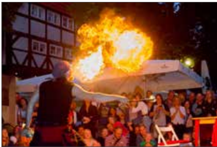
Der Zirkus „Dobbelino“

Für das leibliche Wohl werden Leckeres vom Grill, herzhaftes Fingerfood, Kuchen und Getränke angeboten.