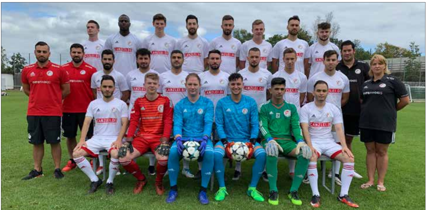
1. Herren Saison 2019/2020