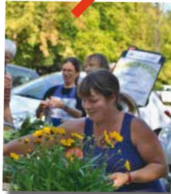
Frisches von der Solidarischen Landwirtschaft Dahlem (SoLaWi)