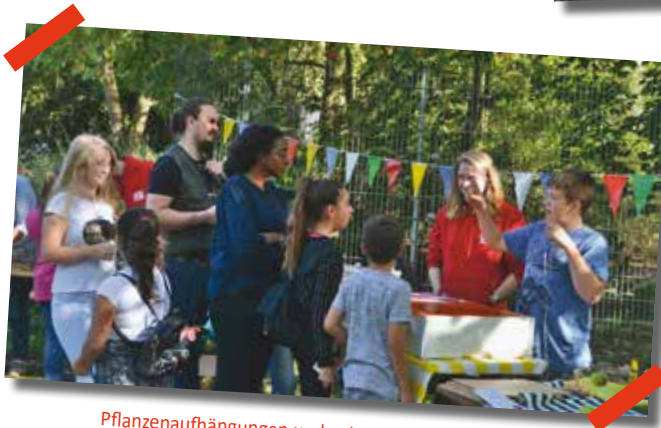
Pflanzenaufhängungen und gelaserte Holzanhänger gab es vom Protohaus Braunschweig