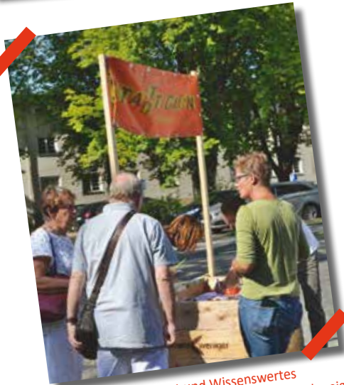
Tomatensaat und Wissenswertes vom Stadtgarten Bebelhof der VHS Braunschweig