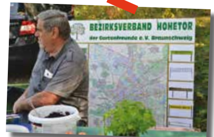
Frische Zitronenmelisse und viele Tipps vom Bezirksverband Hohetor