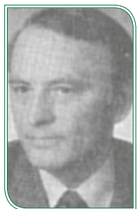
Gerhart Borchers, 1980