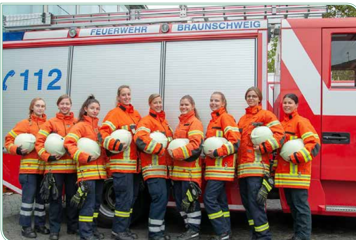
Eine der zwei Löschgruppen am Tag der Feuerwehr in Braunschweig

Im letzten Jahr wurde ein Förderverein für die Ortsfeuerwehr gegründet um insbesondere die Jugendarbeit und die Einsatzabteilung intensiver zu unterstützen.