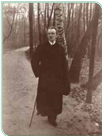
Gerhart Hauptmann, 1898

Eine kleine Hilfe gibt dabei schon einmal ein kleines Zusatzschild, das unter dem eigentlichen Straßennamen zu finden ist. Hier sind kurz die Geburtsdaten, aber auch einige Verdienste der jeweiligen Person stichwortartig aufgelistet. Doch die Verbindung des Dorfes Bienrode mit den Namensgebern der Straßen ist viel größer.