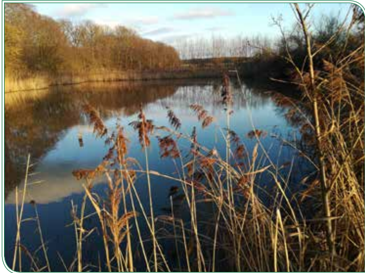
So schön ist die Natur im Biotop