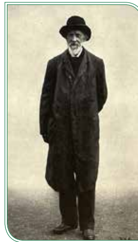
Wilhelm Raabe, 1910

aus Schlesien. Als Erinnerung an den Dichter vergab man im Ort Bienrode dann den Straßennamen. Das größte Werk von Gerhart Hauptmann ist das Buch „Die Weber“.