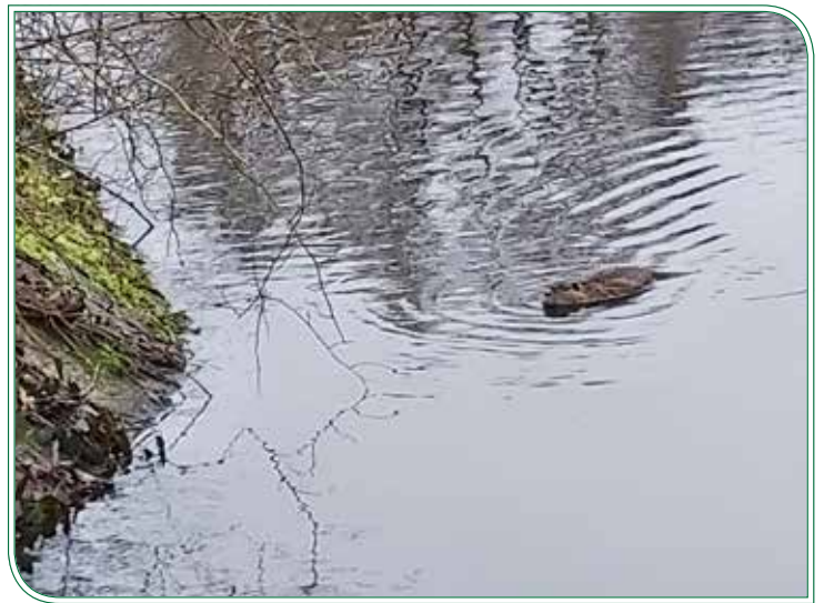
Ein Nutria dreht seine Schwimmrunde

Ursprünglich stammten die Nutrias (auch Sumpfbiber oder Biberratte genannt) aus Südamerika, wo sie in den subtropischen und gemäßigten Klimazonen an Flüssen, Seen, Teichen und Sümpfen leben. Wegen ihres Felles wurden sie allerdings auch in Pelztierfarmen gezüchtet. Vor allem seit dem 20. Jahrhundert, als der Pelztiermarkt zusammenbrach und zahlreiche Tiere entkamen bzw. ausgesetzt wurden, hat sich der Bestand der Nutrias in Europa stark vergrößert. Die zumeist in Kolonien lebenden Tiere können allerdings nur in Gebieten mit milden Wintern überleben. In Deutschland sind die Nagetiere in allen Bundesländern zu finden. Je nach lokalen Gegebenheiten leben Nutrias in Schilfnestern oder graben Höhlen in Uferböschungen, sehr zum Leidwesen von vielen Landbesitzern.