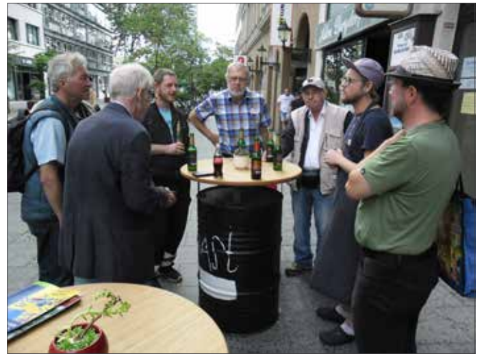
Vor dem „Knast“

Und so schlängelten wir uns durch Gaststätten und vorbei an Sehenswürdigkeiten weiter durch die Innenstadt. Wir lernten neben weiteren kulinarischen Geheimtipps – ich war noch in keiner der besuchten Gourmet-Schatzkammern – auch eine Menge über Braunschweig; zum Beispiel auch, warum wir wohl im Jahr 2031 zum zweiten Mal nach 1861 „Tausend Jahre