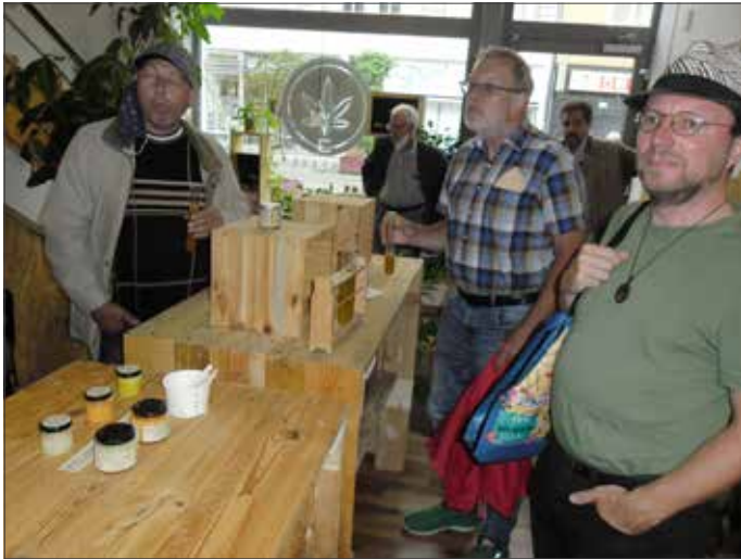
In der Hanfbar

Pandemie-bedingt hatte der Internationale Männer-Treff weniger Gelegenheiten zum geselligen Beisammensein; auch Projekte wie „Männer an den Herd“ lagen auf Eis. So nutzten wir nach hinreichender Lockerung der Infektionsschutzbestimmungen die günstige Gelegenheit einer „Kulinarischen Stadtführung“ mit dem Autor, Foto- und Performancekünstler „Lord Schadt“ (genau genommen: „Lord of Cork Dirk Schadt“) für Beisammensein, Stadterforschung, kulinarische Horzonterweiterung und noch viel mehr.