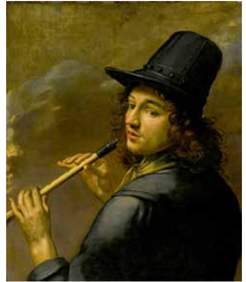
Mann mit Flöte 17. Jahrhundert

Die Blockflöte verschwand erstmal für etwa 150 Jahre aus dem Orchester und fristete ein Schattendasein. Sie wurde aber noch in der Hausmusik in bürgerlichen Kreisen eingesetzt.