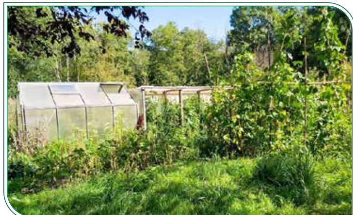
Gemüsegarten mit Gewächshaus

Daneben standen auch bei uns die typischen Sommerarbeiten an, wie Wiesen mähen, Kompost umsetzen und Instandhaltungsarbeiten an Geräten und Gebäuden. Dazu gehört auch die Vervollständigung des Vordaches von unserem Häuschen. Hier waren natürlich die handwerklich geschicktesten Biotopler gefragt, von denen es manchmal allerdings auch zu viel gibt, was nicht unbedingt förderlich für das Vorankommen der Arbeiten ist. Inzwischen steht das Vordach und alle sind zufrieden. Die Fertigstellung wurde dann natürlich einvernehmlich gebührend gefeiert.