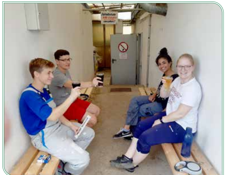
Unsere Fußballfrauen bei einer verdienten Arbeitspause