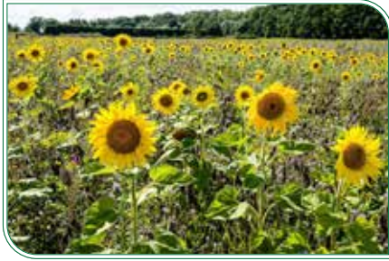
Sonnenblumenfeld mit Biotop im Hintergrund

Der Sommer neigt sich langsam dem Ende zu. Die Tage werden merklich kürzer. Die meisten Felder sind schon abgeerntet und die Obstbäume tragen reife Früchte. Strahlende Sonnenblumen machen ihrem Namen alle Ehre und sind Vorboten des bald beginnenden Herbstes.