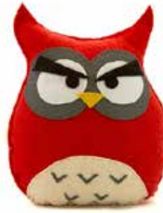
Eule als Maskottchen

Dabei ist es beim Hufeisen etwas sonderbar, dass man Glück hat, wenn man ein Hufeisen findet. Denn eigentlich bedeutet es, dass irgendwo ein Pferd hinkend herumläuft, weil ihm ein Hufeisen fehlt.