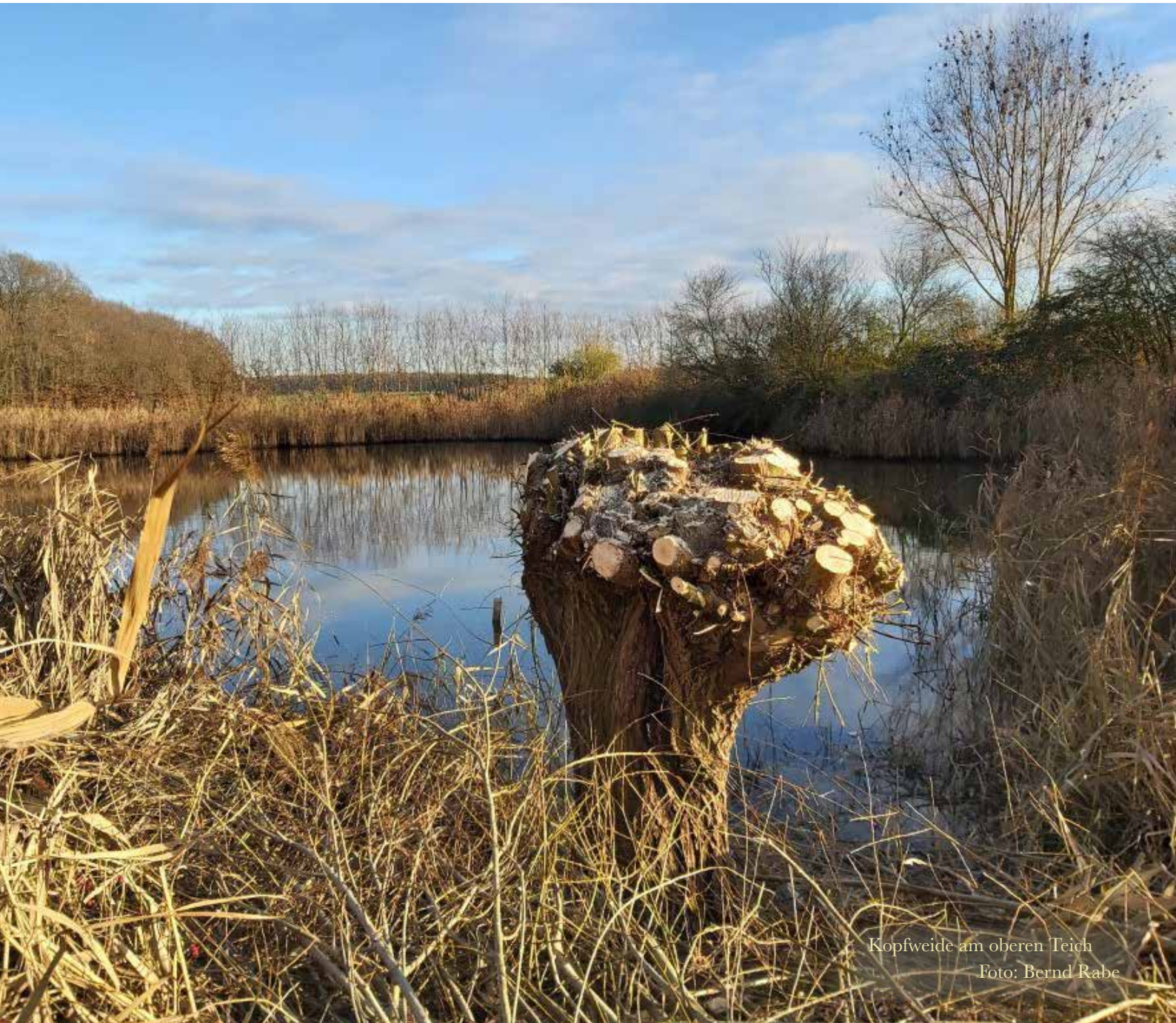
Kopfweide am oberen Teich

Aktuelles aus den Braunschweiger Ortsteilen Waggum, Bienrode, Bevenrode