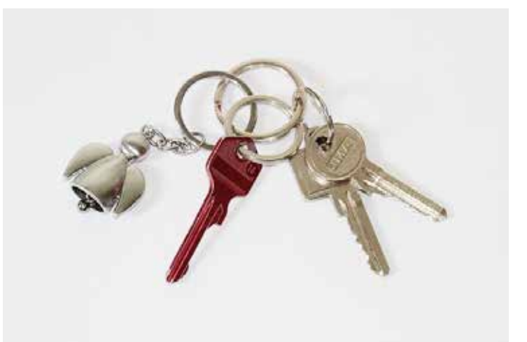
Schutzengel am Schlüsselbund

Zusätzlich können diese geschaffenen Objekte auch das