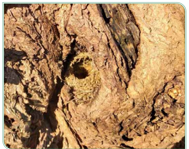
Weidenkopf aus der Nähe, Vogelnest in einer Baumhöhle

Ein ganzes Biotop in einem Baum: Der ökologische Wert von Kopfweiden ist ebenfalls sehr hoch. Diesen Wert entfaltet sie allerdings erst nach einigen Jahrzehnten, wenn sich in den vielen Jahren durch Faulstellen die Baumhöhlen bilden, die gern von Steinkäuzen, Vögeln und Fledermäusen genutzt werden. Auf der Rinde, den Blättern und Trieben sind rund 400 verschiedene Insektenarten zu Hause. Kopfweiden können etwa 90 bis 120 Jahre alt werden.