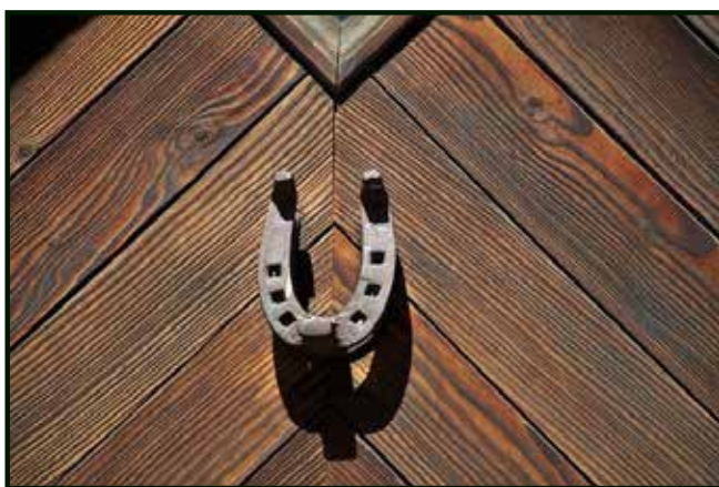
Hufeisen Öffnung nach oben, Glück fällt rein

In vielen Fällen wird das Glück auf Gegenstände projiziert, die als Symbol für das Glück stehen. Diese Dinge können Steine, reale Pflanzen oder auch existierende Tiere sein. Glücksbringer wie das vierblättrige Kleeblatt, der Glückspfennig, der Marienkäfer, der Fliegenpilz, das Hufeisen oder auch das Glücks-