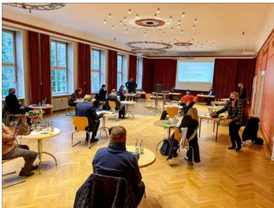
Die Mitgliederversammlung fand erstmals im Kulturpunkt West statt.