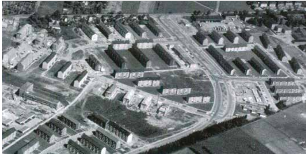
Donaustraße als erste Hauptachse (nördlicher Teil), südlich davon Lechstraße, am linken Rand (Mitte) Schule Altmühlstraße (1963), am nördlichen Rand: Traunstraße mit Siedlung „Friedland“ (1928), bis Teil von Broitzem

Der etwa 260 km lange Lech folgt seinem Ziel nach Norden und erreicht bei Füssen die Allgäuer Alpen. In der Umgebung befinden sich zwischen Schongau und Landsberg zahlreiche Stautufen. Der Fluss erreicht beim Lechfeld die schwäbische Großstadt Augsburg (300.000 Einwohner). In der Umgebung des Alpenflusses gibt es am Nordrand sieben größere Seen, auch bekannte Schlösser wie Hohen Swanstein und Neuschwanstein sind in der Nähe. Die ehemalige römische Provinzhauptstadt wurde um 15 v. Chr. gegründet (Kaiser Augustus). Die tausend Jahre alte Bischofsstadt, die Universität und die historische Innenstadt vermitteln dem Besucher