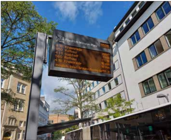
Die neuen DFI-Anzeiger geben in Echtzeit an, wann die nächsten Busse und Bahnen kommen

457 Echtzeitanzeiger werden im Rahmen dieses Projekts insgesamt im Großraum Braunschweig aufgestellt, allein 242 davon im Braunschweiger Stadtgebiet.