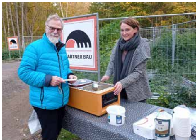
Man kommt ein letztes Mal in diesem Jahr zusammen, bevor auch der Gabenzaun in den Winterschlaf geschickt wird.

Unsere Projekte wären nicht möglich gewesen ohne das Engagement der Kooperationspartnerinnen und -partner, die sich Weststadt-übergreifend zusammengesetzt und spannende Veranstaltungen organisiert haben. Sei es der Aufbau des Gabenzauns im Frühjahr 2021, der durch die Zusammenarbeit des Kulturpunkts West, des Kinder- und Teenyklubs „Weiße Rose“, der Nachbarschaftswerkstatt im Haus der Talente, dem Verein „Päckchen für Braunschweig e. V.“ oder auch der Nähwerkstatt „Flickwerk“ entstanden ist. Dieser Gabenzaun wurde am 1. November 2021 temporär wieder abgebaut, da es in den Wintermonaten zu kalt und nass wird, um die Kleiderspenden an den Zaun zu hängen. Aus diesem Grund bitten wir Sie, keine Spenden mehr abzugeben, bis der Zaun im Frühjahr 2022 wieder eröffnet werden kann. Bevor der Zaun abgebaut worden ist, sind wir, der Kulturpunkt West,