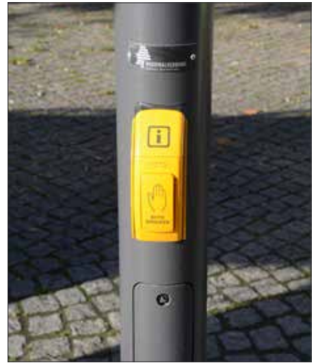
Nach Betätigung des Tasters werden die Informationen auf dem DFI-Anzeiger vorgelesen

Mit den neuen Anzeigern kommt auch ein neues System: Früher konnten nur die jeweiligen Fahrplandaten angezeigt werden – wann also beispielsweise die nächste Abfahrt der Linie 423 geplant ist. Die neuen DFI-Anzeiger sind nun über eine Datendrehscheibe mit den Bordcomputern jedes Busses und jeder Bahn verbunden. So kann über die tatsächliche Position der Fahrzeuge in Echtzeit die jeweilige Ankunftszeit an der Haltestelle angezeigt werden – und die wartenden Fahrgäste an der Haltestelle wissen noch genauer, wann der Bus oder die Bahn einfährt.