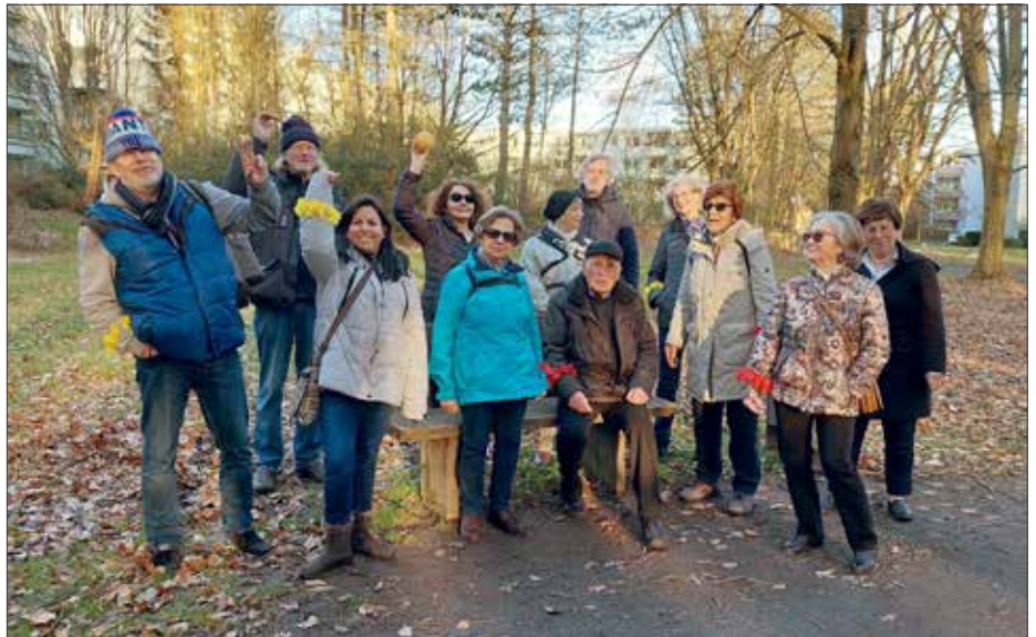
Team Gelb gewinnt