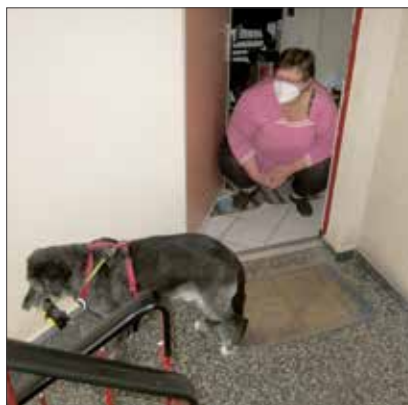
Eddi geht schon mal runter ...

Und bin nicht nur Helfer, sondern suche gerade auch Hilfe bei der Freiwilligenagentur für eine Schüler-Stadtputz-Aktion „außer der Reihe“.