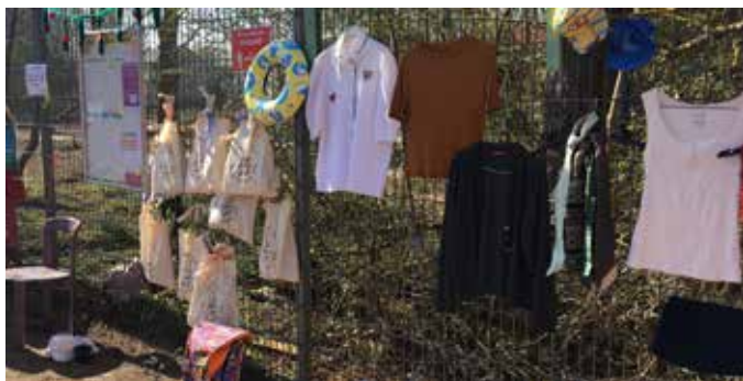
Das Gemeinschaftsprojekt „Der Gabenzaun“ bei seiner Eröffnung im April 2021.

Neben der Eröffnung des Gabenzauns findet auch in diesem Jahr am 25. und 26. März wieder der Stadtputztag in Braunschweig statt. Am 25. März können insbesondere Schulen und Kitas teilnehmen und der Folgetag gilt als allgemeiner Stadtputztag. Auch im Donauviertel hat sich viel Müll in der Umgebung angesammelt, sodass der Kinder- und Teenyklub „Weiße Rose“, der Kulturpunkt West und das Quartiersmanagement sich am 25. März am Stadtputztag beteiligen und das Quartier von Müll befreien. Eine Abschlussfeier in der Braunschweiger Innenstadt wie in früheren Jahren gibt es dieses Jahr nicht. Weitere Informationen zu dem Putztag im Donauviertel erfahren Sie in der nächsten Ausgabe sowie zur Eröffnungsfeier des Gabenzauns.