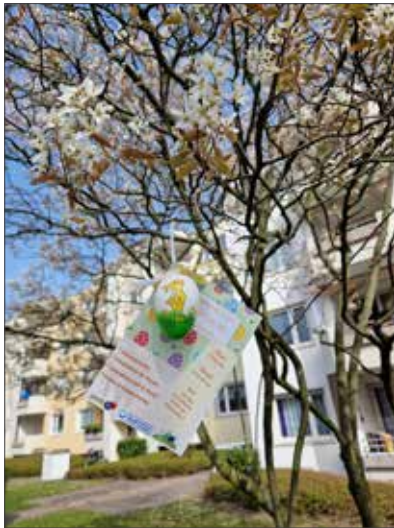
Blühender Tulpenbaum mit Einladung

Die Teams von PartQ und StoP - Stadtteile ohne Partnergewalt haben sich wieder zusammengeschlossen und eine Osteraktion im Emsviertel organisiert. Die Veranstaltung fand am 14. April von 14:00 bis 16:00 Uhr auf der Grünfläche hinter der Emsstraße 3 statt. Der Platz wurde freundlicherweise von der BBG zur Verfügung gestellt.