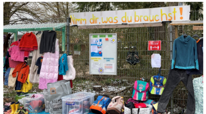
Eine Vielzahl an Kleiderspenden für Groß und Klein am Gabenzaun.

Das Ende der Winterpause wurde am 1. April 2022 durch die Wiedereröffnung des Gabenzaunes eingeläutet! Trotz des kalten Wetters kamen Bewohnerinnen und Bewohner und auch Kinder aus dem Quartier zusammen und konnten sich gemeinsam an der Vielzahl toller Spenden erfreuen. Darüberhinaus hat der Kulturpunkt West selbstgemachte Seifen angeboten und beim Stand des Quartiersmanagements gab es die Möglichkeit, sich ein Päckchen „Müsli-To-Go“ selbst zusammenzustellen. Von nun an bleibt der Gabenzaun für alle Bedürftigen und hilfsbereite Spenderinnen und Spender bis zum 14.10.2022 geöffnet. Das Quartiersmanagement freut sich über den Zusammenhalt der Bewohnerinnen und Bewohner des Donauviertels und bedankt sich bei allen Teilnehmenden. Bereitwillige sind willkommen, insbesondere Hygieneartikel und Lebensmittel am Gabenzaun abzugeben.