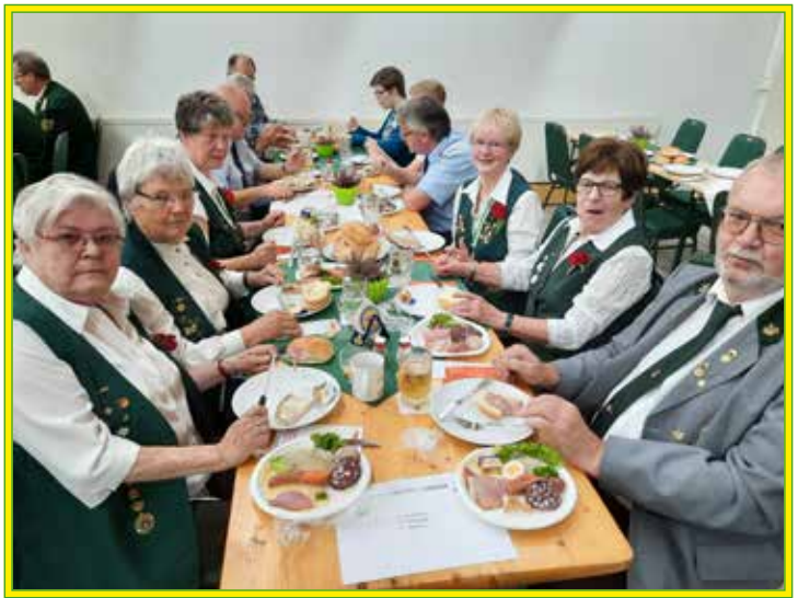
Bei den Schützen in Hondelage, 26.9.2021