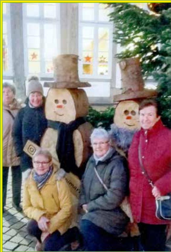
Fahrt nach Hameln mit dem Kreisverband am 30.11.2019