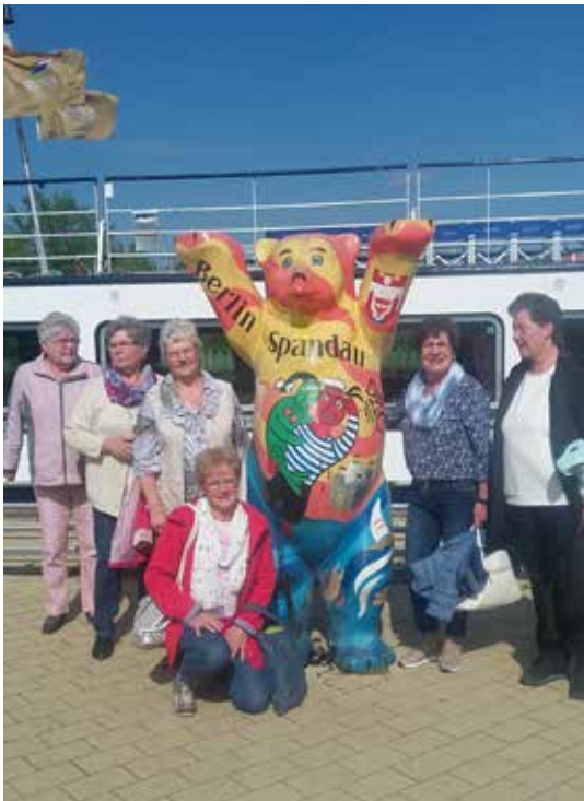
Muntere Kanalfahrt Berlin-Braunschweig im Mai 2019