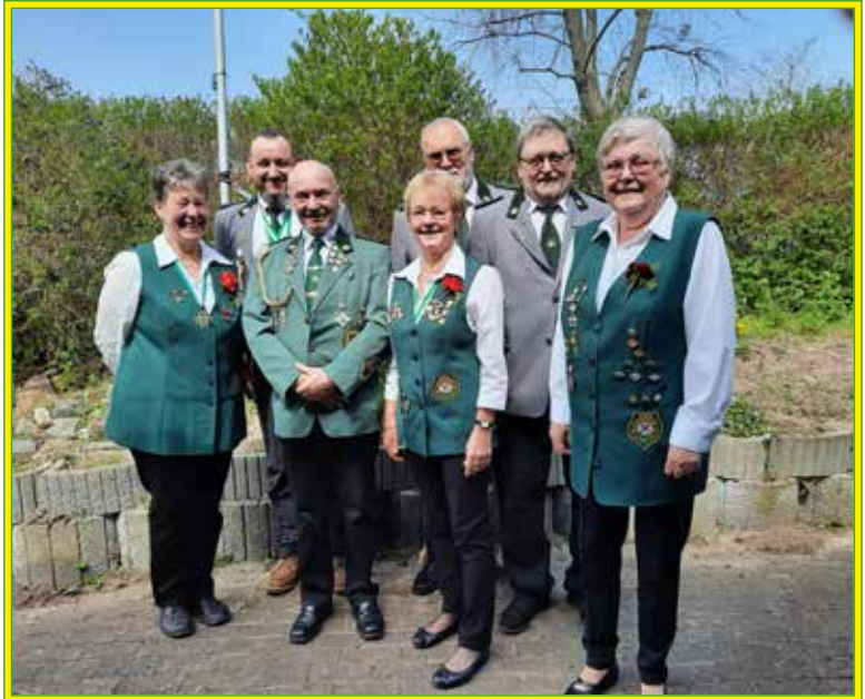
Unser Vorstand, 24.04.2022