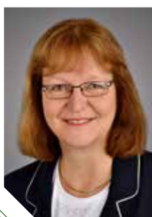
Mit herzlichem Gruß Ihre Meike Rupp-Naujok, Bezirksbürgermeisterin Südwest

Ich wünsche Ihnen allen, auch im Namen des Stadtbezirksrates Südwest, einen guten Start ins Jahr 2023!