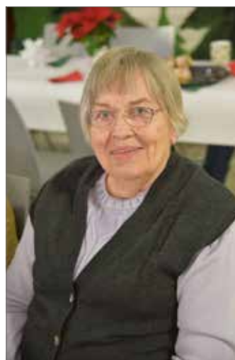
Die älteste Teilnehmerin