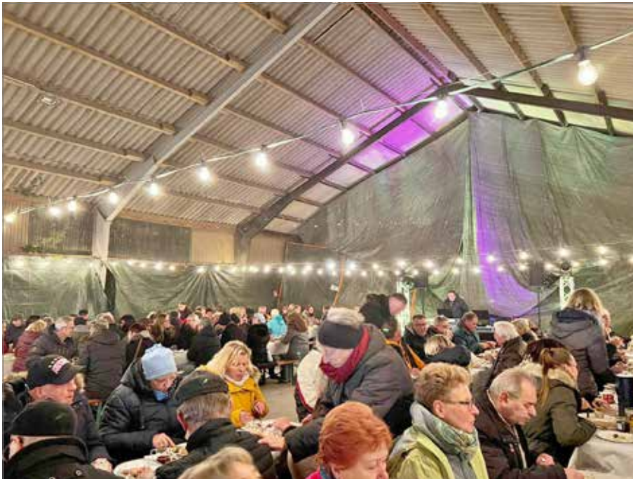
Tolle Stimmung beim Timmerlaher Schlachtessen in „Voges Scheune“

So mundete allen Teilnehmerinnen und Teilnehmern die Wurst ausnahmslos gut. Ein Grund ist sicherlich, dass Hausschlachter Weigel traditionell eine wohlschmeckende Mettwurst im Darm, leicht angeräuchert, herstellt, von der Insider sagen, sie gehöre wohl mit zu „den besten im Lande“.