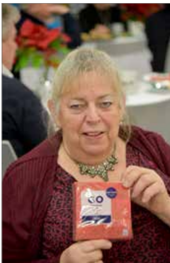
Von ihr kam die erste Anmeldung