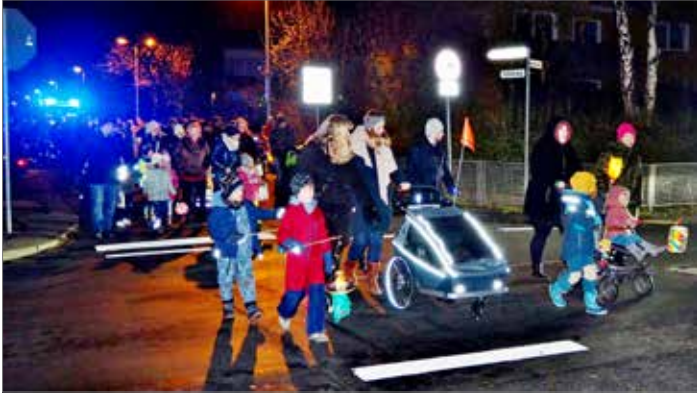
Los geht's. Viele bunte Laternen schmücken das Bild.

Endlich war es wieder so weit: Nach drei Jahren Corona-Pause lud der TSV Timmerlah wieder zum traditionellen Lampionumzug ein. Viele, insbesondere natürlich die Kleinsten, hatten sehnlich darauf gewartet. Die Teilnehmerzahl war dementsprechend groß.