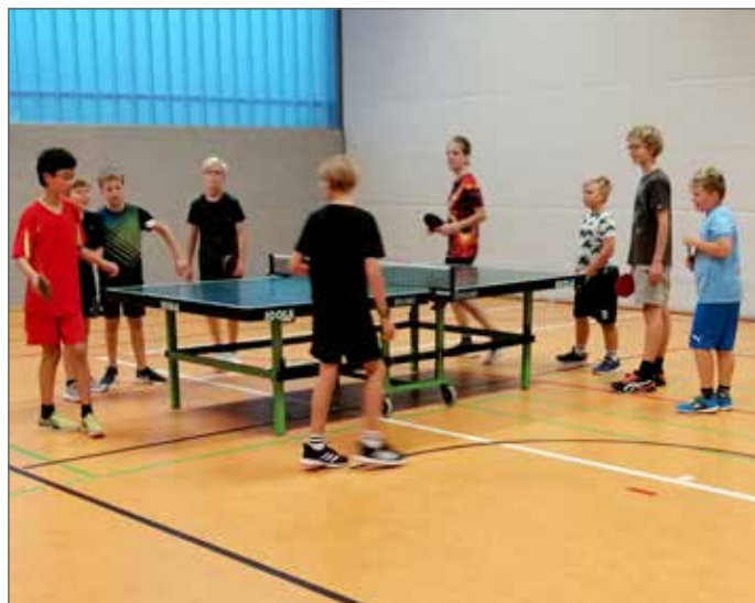
Jugendtraining am 12.09.2022, Rundlauf

Es nehmen regelmäßig bis zu 14 Jugendliche am Training teil. Hier konnten zahlreiche neue Mitglieder für den TSV Schapen gewonnen werden. Neben dem Einsatz der Ballwurfmaschine finden mittlerweile verschiedene Aufwärmspiele sowie Zielübungen mit dem Tischtennis Ball statt.