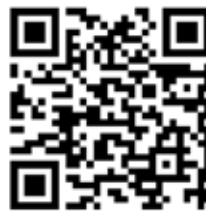
Videobeispiel Double Disc Court

Viel besser als Erklärungen zu lesen, ist in diesem Fall Beispiele anschauen. Hier gibt es eine Runde DDC im Video zu sehen: https://youtu.be/H_fKmD-Ntnk