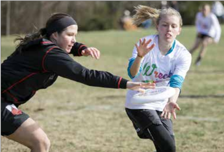
Kann die Verteidigerin die Scheibe erfolgreich abfangen oder zu Boden bringen, wechselt der Angriff.