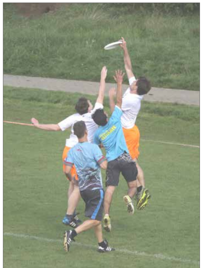
In der Endzone ist die Frisbee-Scheibe heiß umkämpft, denn hier werden die Punkte gemacht. Körperkontakt ist dabei jedoch nicht erlaubt.