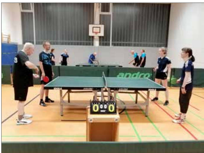
Punktspiel 5. Herren am 15.09.2022 gegen Freie Turner.