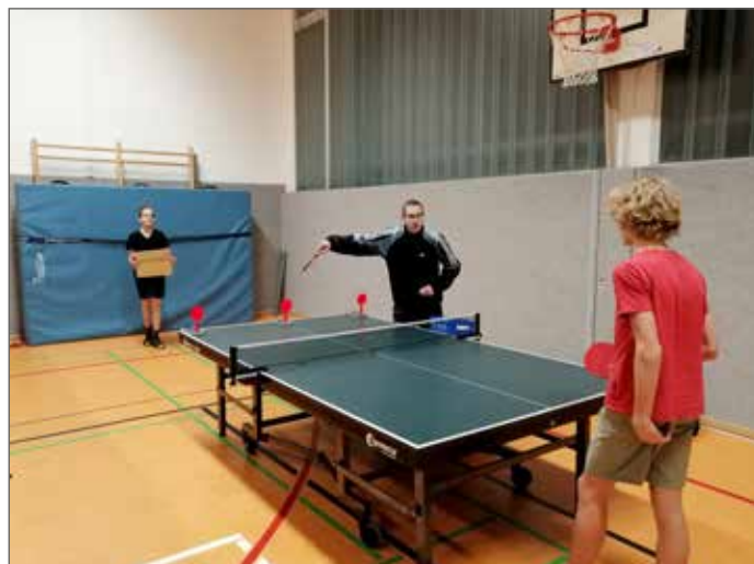
Jugendtraing am 19.12.2022 Zielübungen