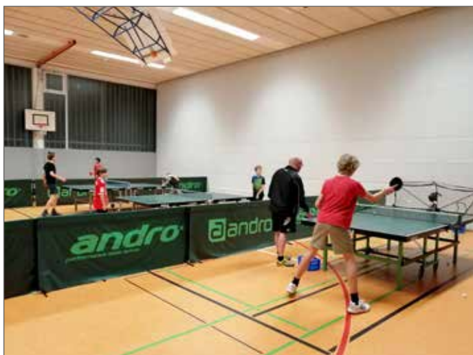
Jugendtraining am 19.12.2022 Ballmaschine