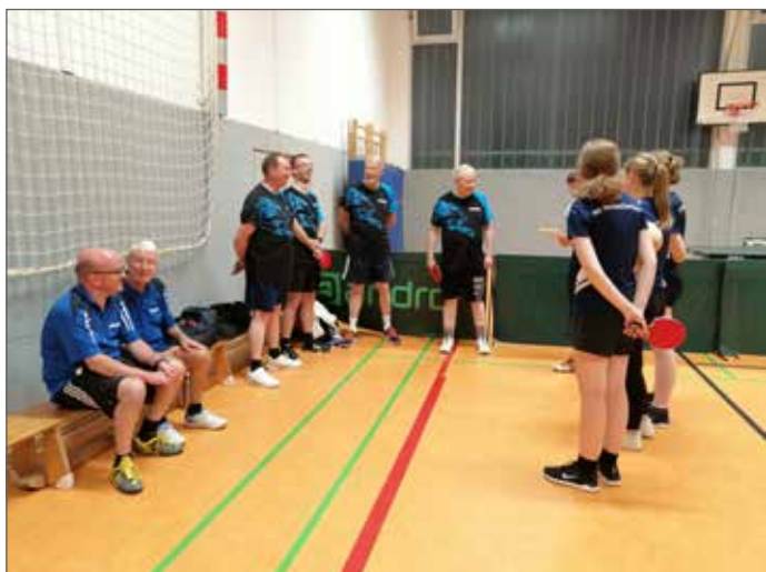
Punktspiel 5. Herren am 15.09.2022 gegen Freie Turner