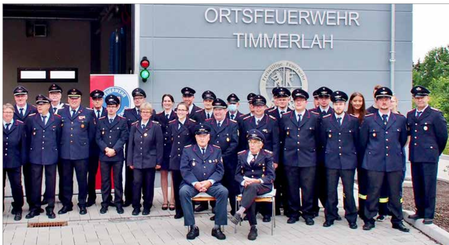
Die freiwillige Feuerwehr Timmerlah im August 2021 anlässlich der Übergabe des neuen Feuerwehrhauses.