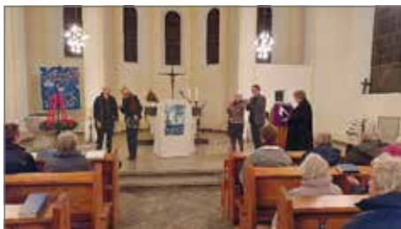
Im Dezember 2022 konnte dann endlich die neue Kanzel in einem Gottesdienst eingeweiht werden.

Deckengemälde sowie die Malerarbeiten des Innenraumes.