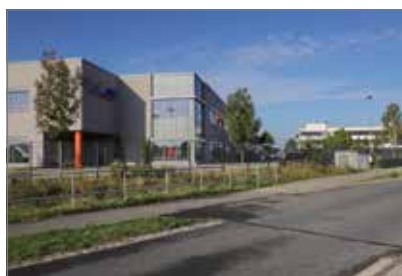
Heute ist das ganze Areal bis auf einen überschaubaren Rest überbaut

Das Gräberfeld zieht sich vom südlichen Rüniger Gewerbegebiet bis an das Geitelder Holz. Seine Erforschung war von hohem wissenschaftlichem Interesse, weil die Grabanlage nicht durch tiefgründige Bodennutzung zerstört wurde.