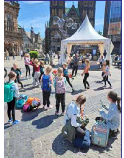
Stadtrundgang in Bremen