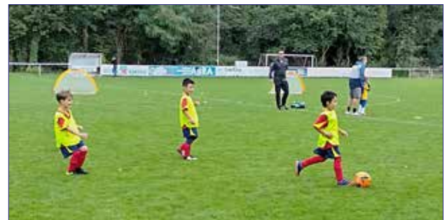
Spielrunde in Querum