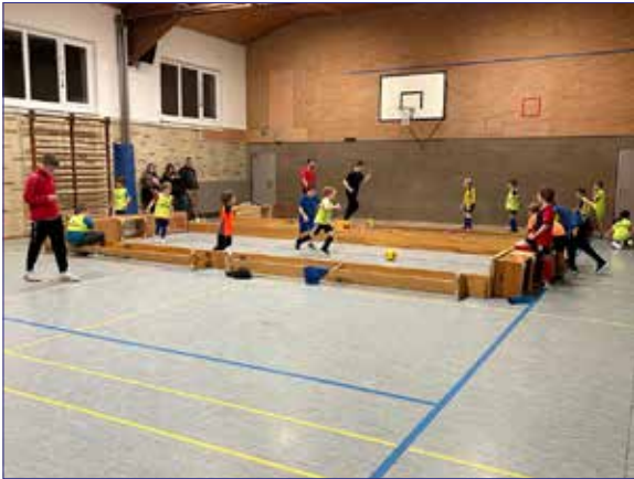
Teamtraining am Samstagnachmittag