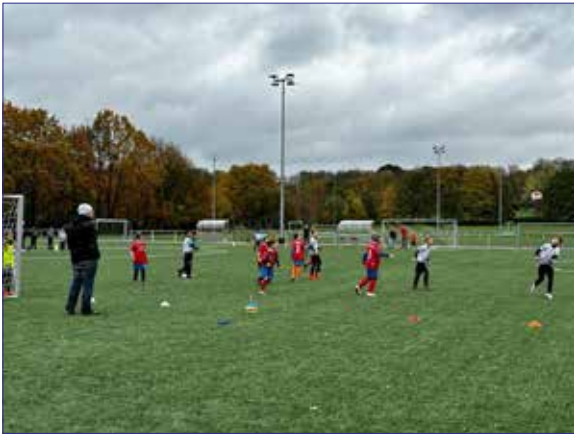
Spielrunde auf dem Rasen