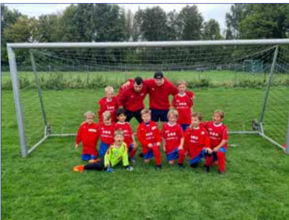
F2 nach vollbrachter Spielrunde

In der Rasensaison haben die Kids aus der ehemaligen G-Jugend und aus der bereits vorhandenen F-Jugend neu zusammen gefunden. Alle haben fleißig von uns Trainern, aber auch von den eigenen Teamkameraden gelernt und harmonieren inzwischen gut. Das Team ist auf über 25 Kinder angewachsen, die sich an zwei Trainingsterminen die Woche jeweils 90 Minuten auspowern und ihr Können beweisen konnten.