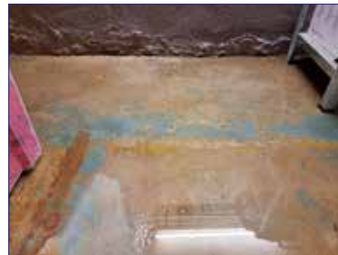
Wassereintritt durch undichte Wandabdichtung