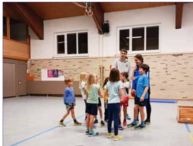
In der Ballspielgruppe geht es hoch her

Der nächste Höhepunkt ist für den 16. März geplant. Wir wollen wieder, wie bereits im vergangenen Jahr, mit interessierten Kindern am traditionellen Drohnn-Youth-Bowl, einem Faustballturnier für Kinder, mitspielen. Die Kinder, die sich dafür anmelden, werden vorher mit den Regeln vertraut gemacht und trainieren für das Turnier.