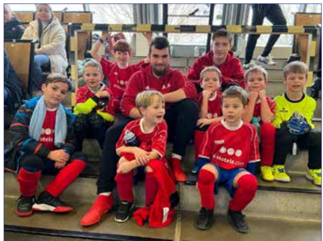
Warten auf das nächste Spiel bei der Hallenspielrunde in Rünigen