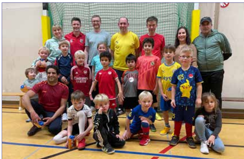
Foto nach vollbrachten Eltern-Kind-Turnier vor Weihnachten.