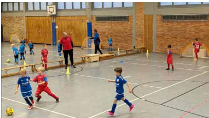
Spielrunde in Rünigen