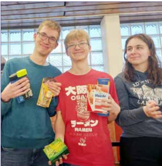
Neujahrsturnier beim SV Erichshagen

Am 7. Januar nahmen die Faustballer des SCE Gliesmarode am Neujahrsturnier des SV Erichshagen teil.