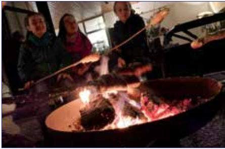
Team-Abend beim Nachwuchs