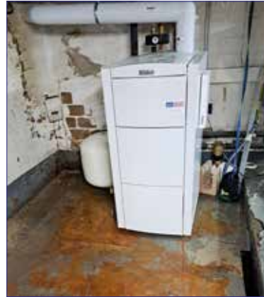
Heizungskessel mit „nassen“ Füßen

Von den Auswirkungen des Starkregens Ende des Jahres sind auch wir nicht ganz verschont geblieben. Durch Undichtigkeiten in der Kellerabdichtung ist Schichtenwasser eingedrungen. Dieses musste im Bereich um den Heizungskessel mehrere Tage abgepumpt werden. Im Keller zum Sportplatz war es mit Aufwischen getan. Wenn alles wieder gut abgetrocknet ist, soll die Abdichtung erneuert werden.