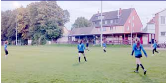
Bezirksoberliga-Spieltag der Frauen in Gliesmarode

– SCE-Frauen in der Halle an Tabellenspitze