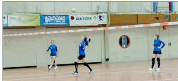
Hallenspieltag der Bezirksoberliga in Lehre

Am 3. Dezember fand dann der 1. Spieltag der Hallensaison statt. Ihre Ausfälle gut kompensiert haben dabei die SCE-Faustballerinnen. Beim Bezirksoberliga-Spieltag in Lehre wurde das SCE-Team durch eine Gastspielerin und durch U18-Jugendspieler verstärkt.