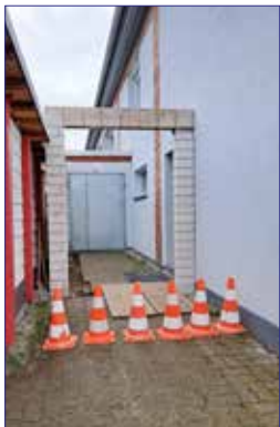
Ganganbau auf der Ostseite