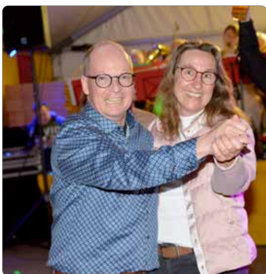
Die Fotos sind von Helmut Korsch. Er hatte sich auch die Mühe gemacht, zu jedem Tag einen Bericht zu schreiben, was aber leider hier den Rahmen gesprengt hätte.

Ich bitte um Verständnis. hm medien, Heidi Miklas