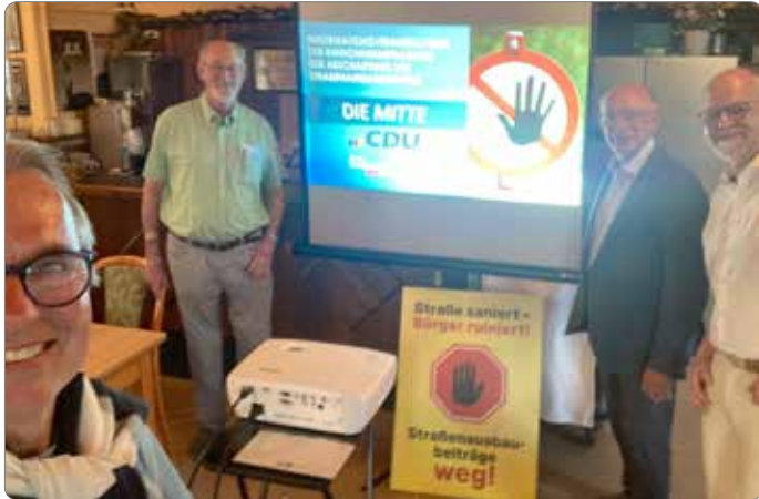
Die Ratsherren der Ratsgruppe Die MITTE informierten über die Straßenausbaubeiträge:

Am 14. Mai 2024 begrüßte die Ratsgruppe Die MITTE (CDU/FDP/Haie) im Gasthaus „Bei Chris“ in Cremlingen erstmalig zahlreiche Bürgerinnen und Bürger zu einer Informationsveranstaltung zu den Straßenausbaubeiträgen in der Gemeinde Cremlingen und deren geplanter Abschaffung.