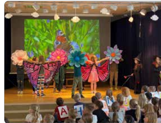
Blumenerwachen – Tanz der Klasse 1b