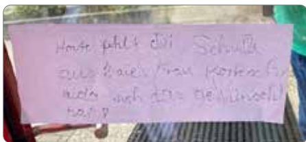
Aushang an der Schuleingangstür 😊