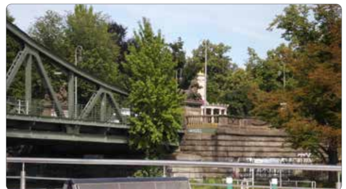
Glienicker Brücke vom Schiff aus