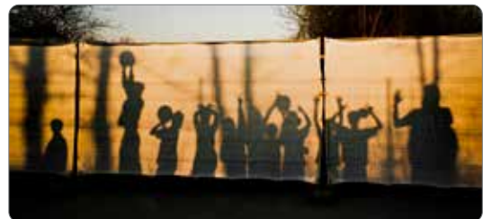
Der Platz wird super angenommen