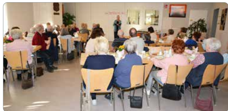
Anwesende im Dorfgemeinschaftshaus

Zur Unterhaltung trug Pfarrerin Christine Heuser wieder ein Spiel bei, an dem sich alle Anwesenden beteiligen konnten. Es gab fünf Vorschläge, die alle das Thema Ostern beinhalteten und zu jedem Thema gab es fünf Schwierigkeitsgrade. Es wurden drei Mannschaften gebildet, die jeweils ein Thema mit Schwierigkeitsgrad wählten und die damit verbundene Frage beantworten mussten. Gewinner war die Mannschaft mit den meisten er-