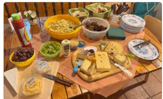
Das Essen zur Stärkung nach der Sitzung

Mit dem dreifachen Schützengruß „Gut Schuss“ wurde nach knapp einer Stunde die Sitzung offiziell beendet. Jetzt konnten sich die Anwesenden am mitgebrachten Buffet stärken. Es gab Frikadellen und warme Würstchen zu Kartoffelsalat. Ebenfalls stand eine reichhaltige Käseauswahl bereit. Zur flüssigen Stärkung wurde auch noch eine Runde der amtierenden kleinen Königin Daria Helck ausgeschenkt. Um 22:00 Uhr wurde der Vereinsabend nach netten und interessanten Gesprächen beendet.