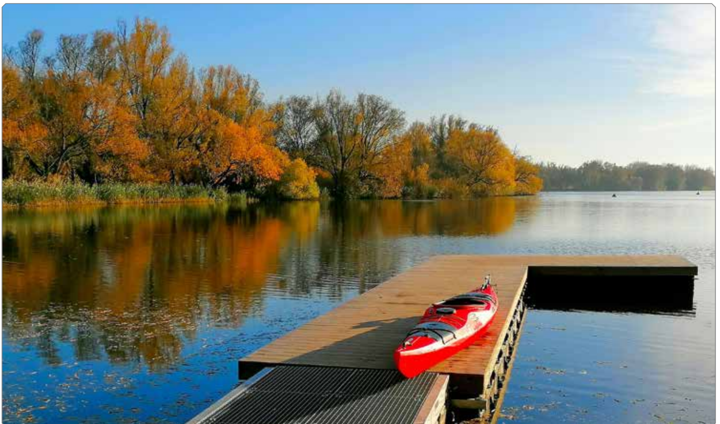
Der Indian Summer ist noch nicht vorbei – begleitet von einem Wehmütigen Rest Sommer.