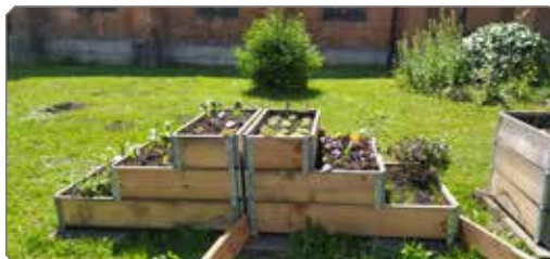
Bereits vorhandene Beete