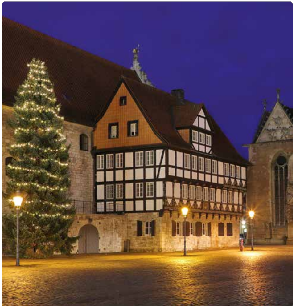
Das ehemalige Rüniger Zollhaus, jetzt hat es seinen Platz am Altstadtmarkt.