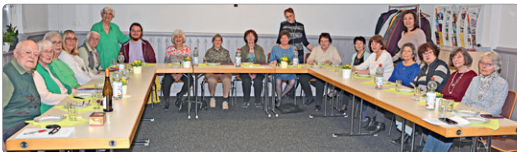
Vorstand und Mitglieder vom Frauenchor Weddel.