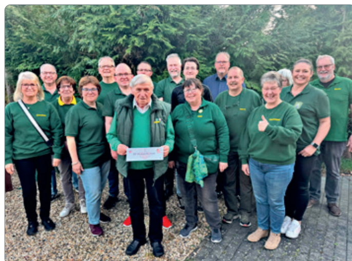
Die Wabeschützen nach der Siegerehrung in Hondelage