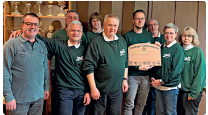
Schießsportleiter des SVS und Teilnehmer des SSV-Weddel