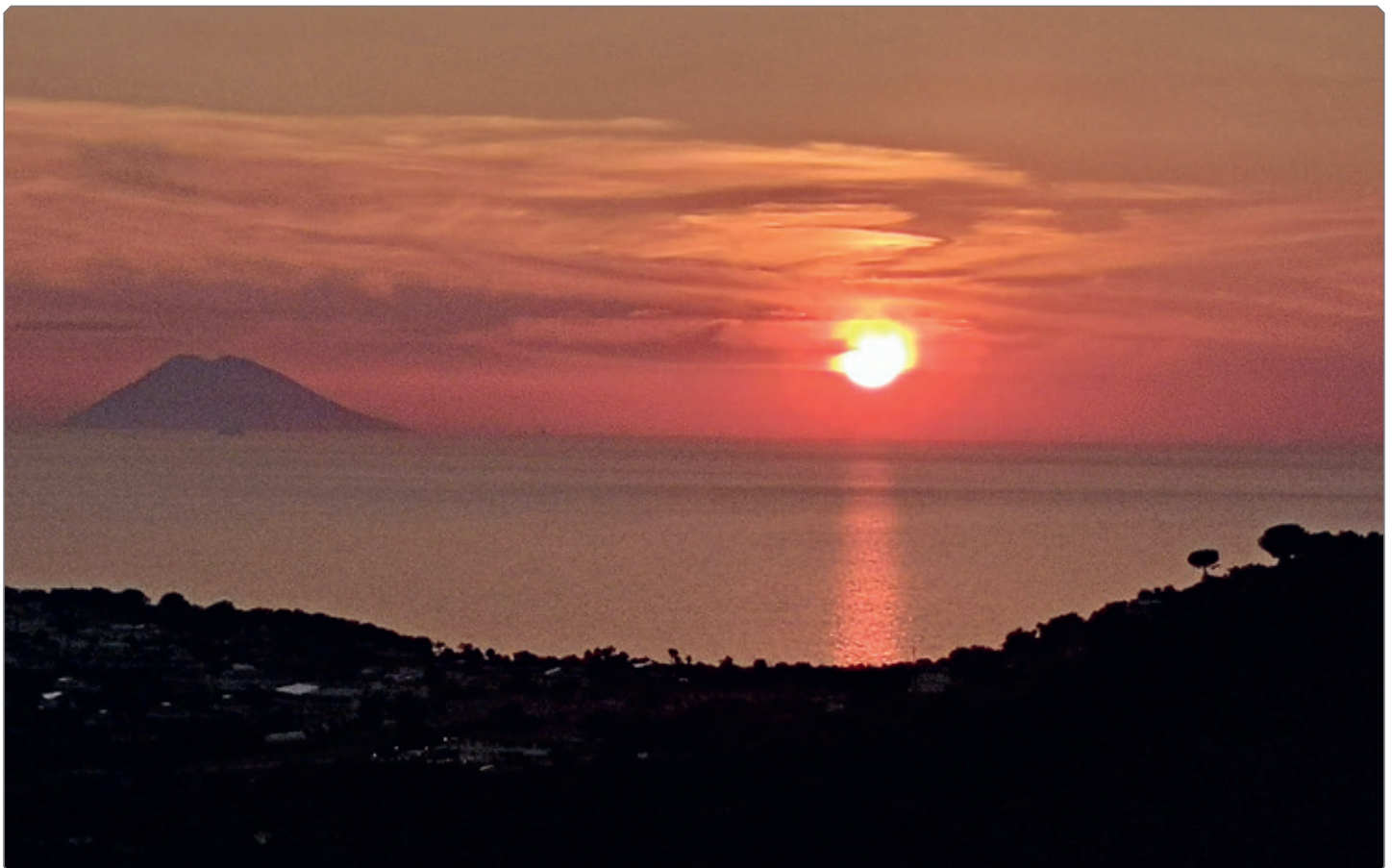
Bella Calabria, Kalabrien, Sonnenuntergang mit Blick auf Stromboli.