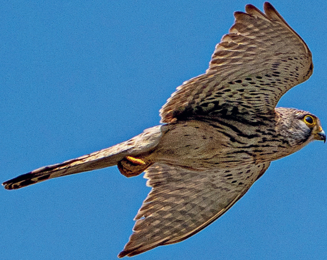
Turmfalke in Rünigen.