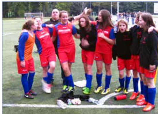
Nach dem Sieg gegen FT Braunschweig

Insgesamt kann ich meine Mädels nur loben die sich in dieser Hinrunde im wahrsten Sinne des Wortes in jedem Spiel den A... aufgerissen haben, sie haben gezeigt, dass sie kein Fallobst und keine Schießbude mehr sind. Unser Motto „Gemeinsam sind wir stark“ ist vollkommen aufgegangen! Mein Kader bestand nur aus 9 Spielerinnen, aber durch die Super-Teamlleistung hatte ich hin und wieder das Gefühl, das wir viel mehr wären. Jede einzelne Spielerin kämpfte für zwei, manche sogar für drei. Also wenn es hierfür Noten geben würde, dann gebe ich für diese Team- und spielerische Leistung die Note 1++, genial! Dies heißt aber nicht, dass wir 2014 kein Training mehr brauchen, sondern dies zeigt nur, dass wir durch das Training zu diesen Leistungen gekommen sind. Wir müssen noch viel arbeiten, um eine konstante Leistung zu bringen und um in der Rückrunde noch einen drauf zu legen.