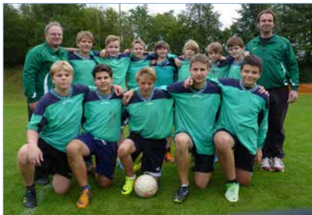
Bezirksauswahl männlich U14