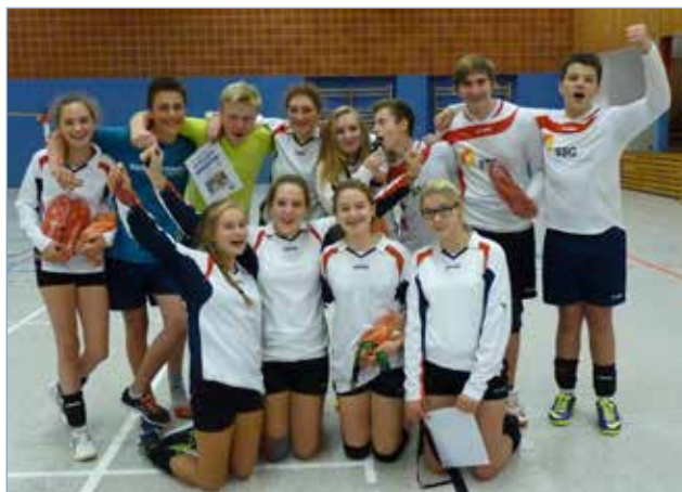
Indoor Masters U18