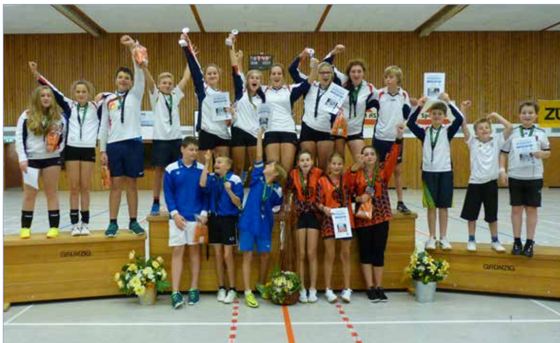
Podiumsplatz für die U14 und die U16

Die SCE-Mädchen waren mit drei Teams vertreten, die auf die drei Vorrundengruppen verteilt