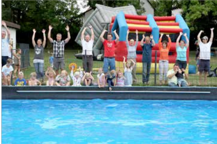
Mit einer anständigen Laola-Welle werden die TeilnehmerInnen am Arschbombenwettbewerb angefeuert.