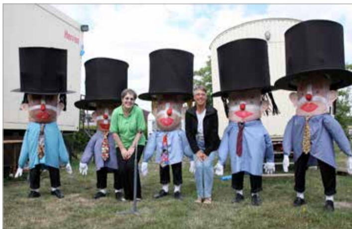
Die Mitglieder des MGW-Waggum haben Spaß daran, viele Menschen zu begeistern, nicht nur mit Gesang.