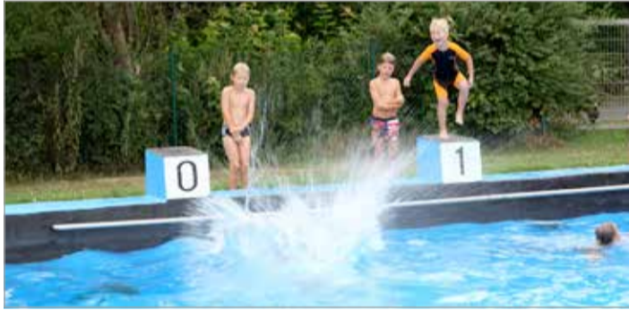
Die Preise gab's anschließend von Miss Braunschweig