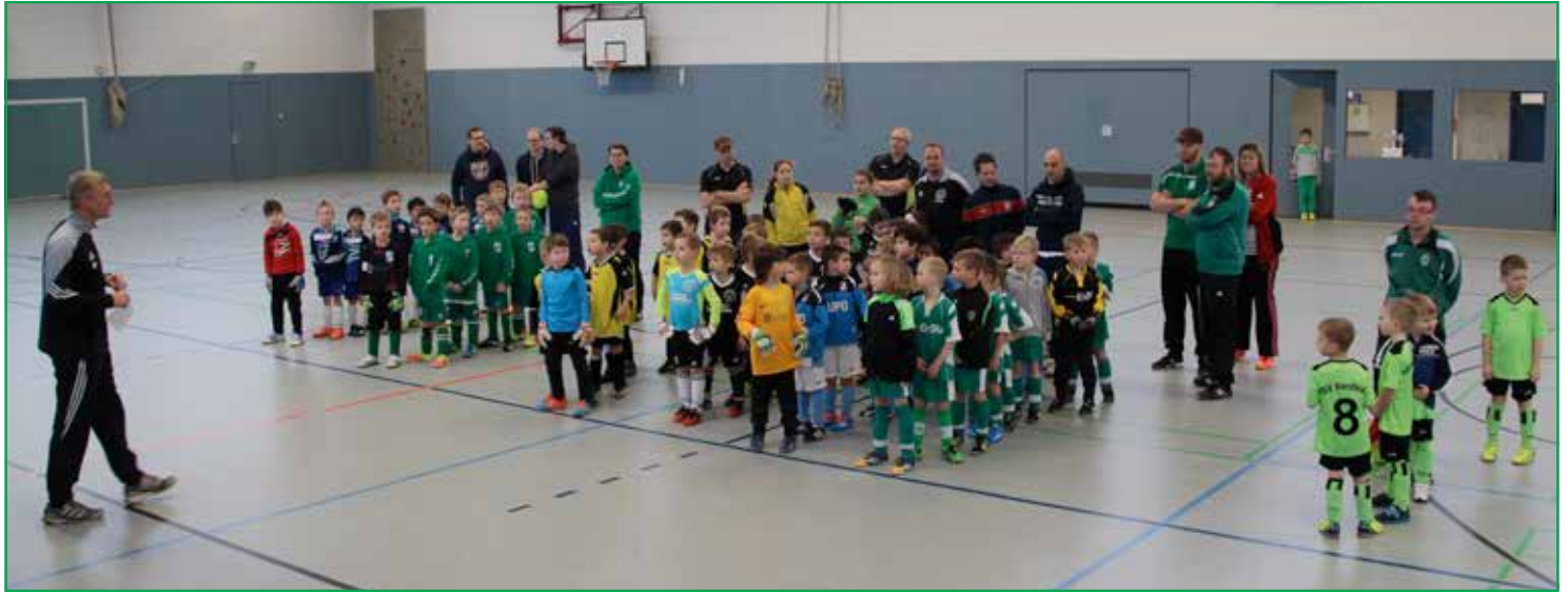
Begrüßung der Mannschaften ...