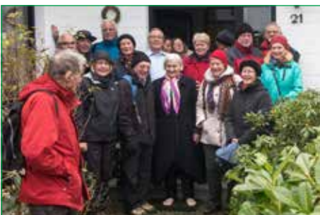
TVM-Wanderung rund um Wolfenbüttel