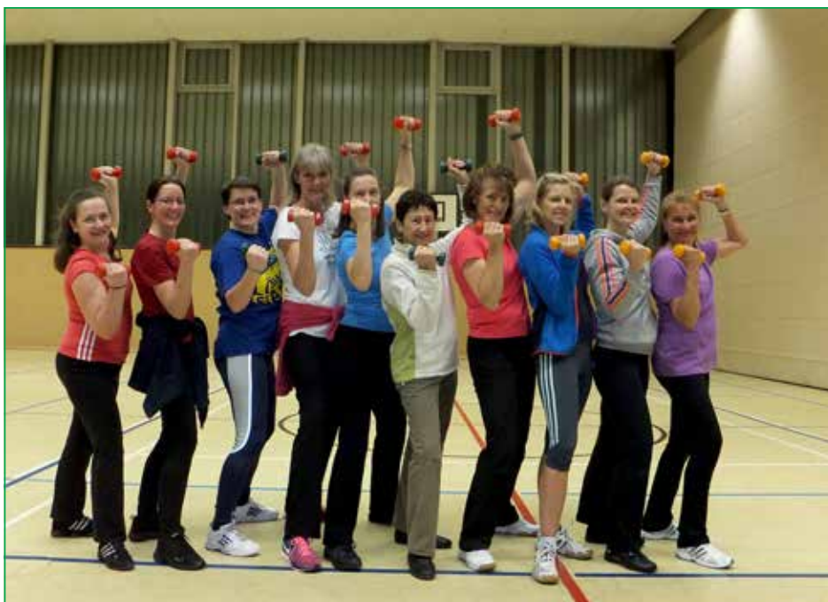
Kostenloses Schnuppertraining jederzeit erwünscht!