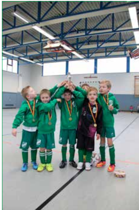
so sehen Sieger aus ... (2. Platz)