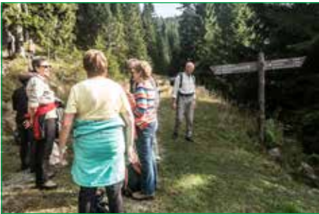
Wanderung Dammhaus Stieglitzecke