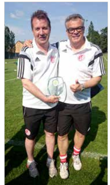
Abschlussfahrt nach Scharbeutz