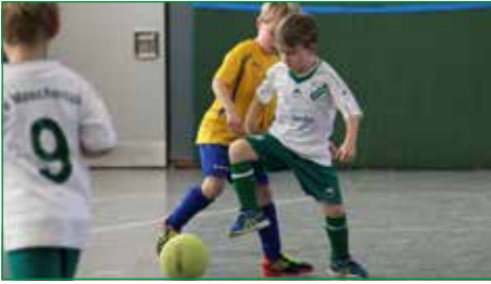
Theo behauptet den Ball