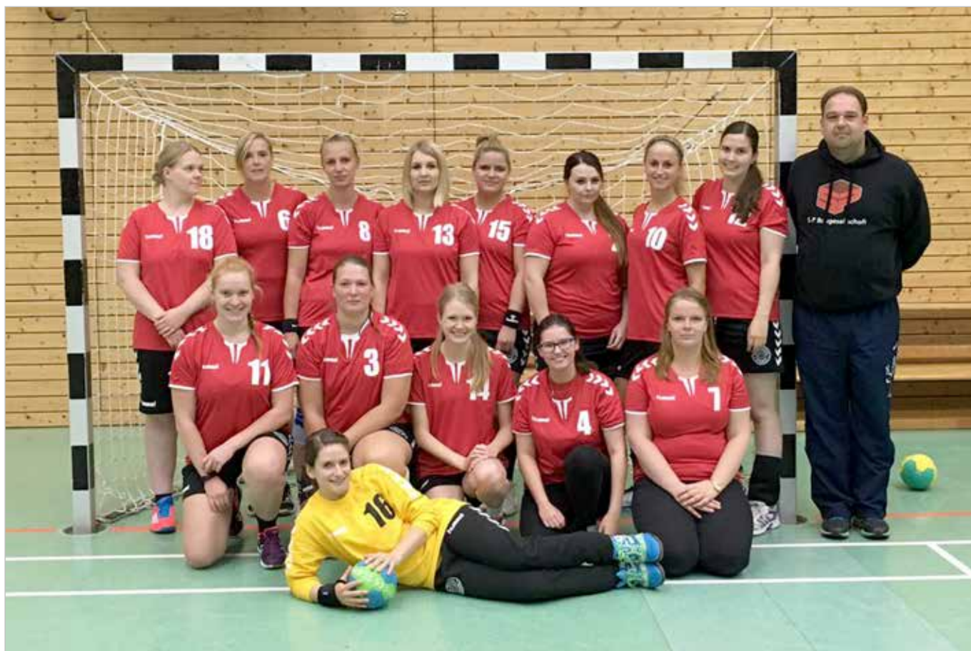
Die MSG Volkmarode/Lehre, ein Zusammenschluss der Volkmaroder Handball-Damen und der 2. Damenmannschaft des VfL Lehre.

Unsere Handball-Damen treten in der laufenden Saison 2016/2017 in einer Spielgemeinschaft mit der 2. Damenmannschaft des VfL Lehre an. MSG Volkmarode/Lehre ist der Name dieser bunt gemischten Truppe im Alter von 18 bis 50+ Jahren, für die der Spaß am Handball und der Teamgeist an erster Stelle steht.