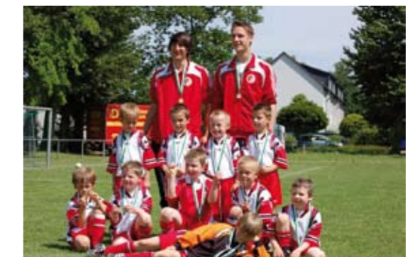
Turniersieg in Velfenhof