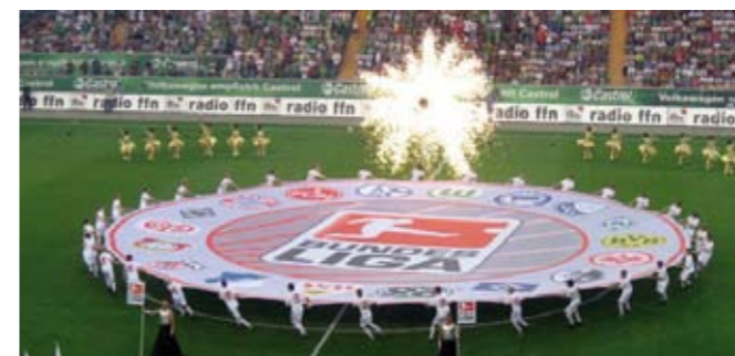
30.000 im Stadion, Millionen an den Bildschirmen! Wir haben den Dreh raus!

Ein weiteres, wenn auch nicht sportliches Highlight war sicherlich unsere Teilnahme an der Saisoneröffnung der Fußball-Bundesliga im Stadion des amtierenden Deutschen Meisters VfL Wolfsburg.