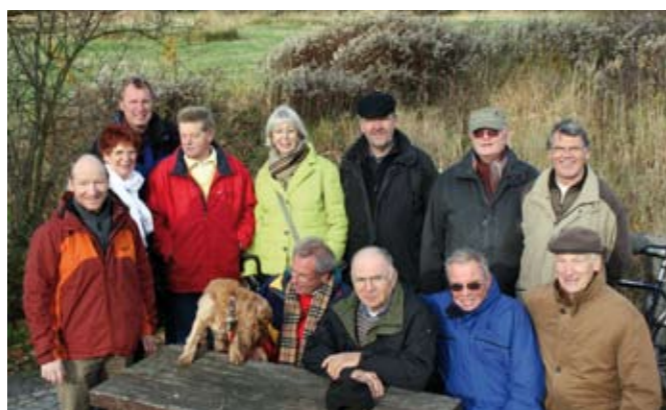
Ein Teil der Herrengymnastiker bei der Braunkohlwanderung 2009

Wir kommen nicht nur zum Sport zusammen, sondern pflegen auch die Geselligkeit in der Gruppe. Sommergrillen, Braunkohlwanderung und Weihnachtsfeier sind ein fester Bestandteil unserer Abteilung.