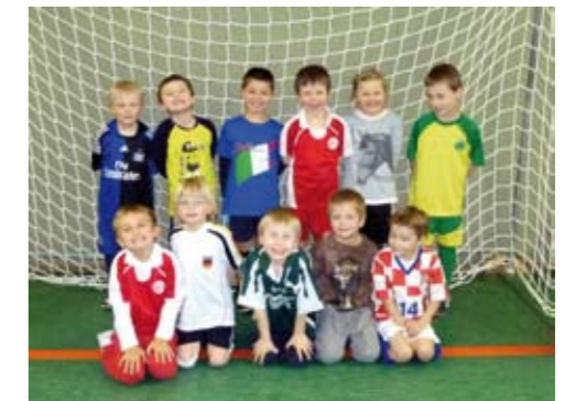
Ein kleiner Teil der wilden Bande