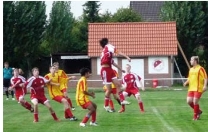
Spielszene vom 7:1 Kantersieg gegen Schwarzer Berg. Vollgas auch in der Luft!

Ich möchte nicht zu viel von der Mannschaft verlangen und denke, dass unser Kader für diese intensiven Spiele auf Dauer zu dünn besetzt ist. Allerdings ist das Leistungsvermögen allemal vorhanden, um am Ende der Spielzeit ein weiteres Highlight für den SC Rot-Weiß Volkmarode zu setzen.