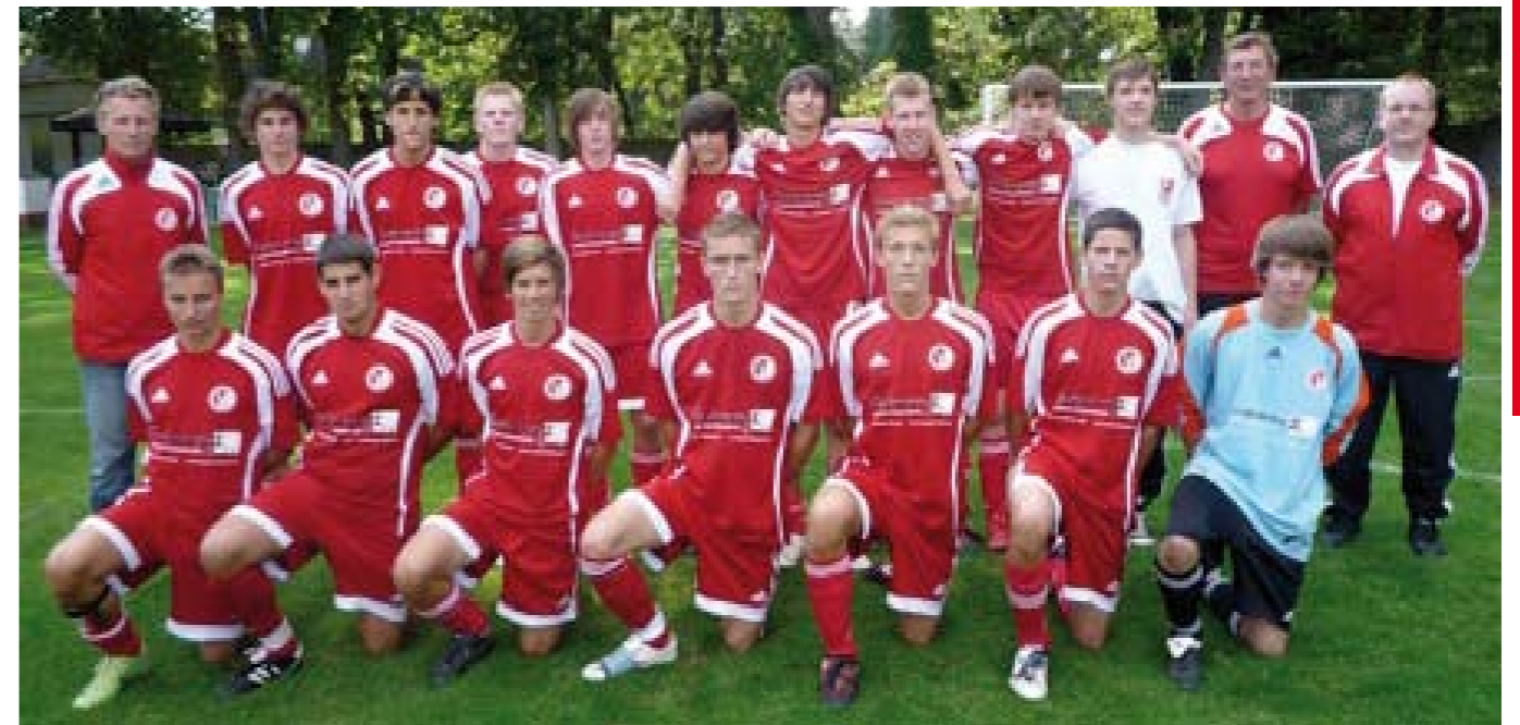
Das Team der Spielzeit 2009 / 2010:

Aber auch außerhalb des Platzes sind das alles gute Jungs, die eine vorbildliche Gemeinschaft pflegen. Sei es zur Weihnachtsfeier, zum Kickerturnier, oder bei Feierlichkeiten zeigt die Truppe „Durchhaltegeist“ und Zusammenhalt.