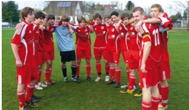
Ein tolles Team! Einschwörung auf eine heißes Pokalhalbfinale.

Eine feine Serie ist gespielt und unser Nachwuchs wurde souverän und völlig verdient verlustpunktfreier Staffelsieger in der Kreisklasse. Das ist die eine gute Nachricht. Die nächste gute Nachricht ist die, dass wir uns damit für die Kreisliga qualifiziert haben und uns dort mit Braunschweigs besten Mannschaften messen dürfen. Eines vorweg: Auch hier müssen wir uns nicht verstecken, denn in dieser Mannschaft steckt das Potential, um auch diese Herausforderung zu meistern!