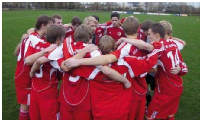
Verlängerung! Motivation ist alles. Fußball wird im Kopf gespielt!

Das Schöne ist, dass diese Jungs in der Lage sind, auf eine Art und Weise Fußball zu spielen, dass manch ein Zuschauer mit der Zunge schnalzt. Ich denke hierbei unter anderem an die Pokalbegegnung im Halbfinale gegen den FC Wenden. Ein hochklassiges Match, ein Spannungsbogen wie in einem guten Krimi, Dramatik pur, Verlängerung, und dann als zweiter Sieger erhobenen Hauptes vom Platz gegangen.