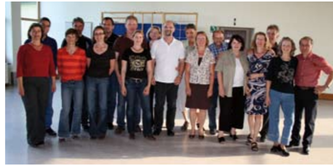
Die neue Gruppe der Tanzabteilung

Neben unseren Übungsstunden haben wir noch andere Aktivitäten für unsere Tänzer im Programm. Bei der Sportschau der Turnabteilung des Vereins sind wir regelmäßig dabei. Ein