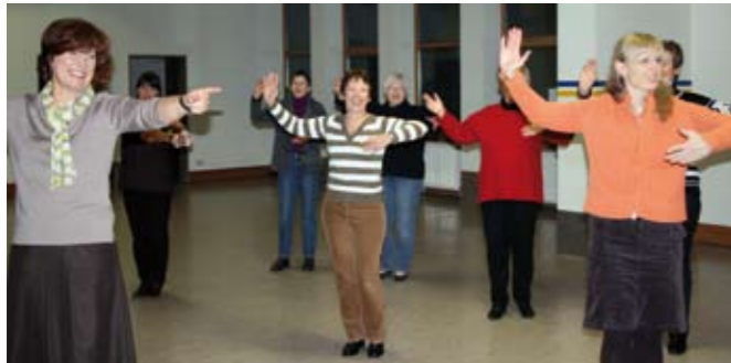
Unsere Damen üben Tanzschritte, damit die Herren gut führen können.

Seit Beginn des Jahres 2009 gibt es in unserem Verein zwei Tanzgruppen für Standard- und Lateintänze. Beide Gruppen bestehen z. Z. aus je 10 Paaren, die sich regelmäßig in der Sporthalle der SKG Dibbesdorf treffen.