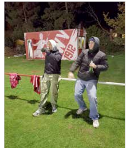
Unsere Ü40 Ultras