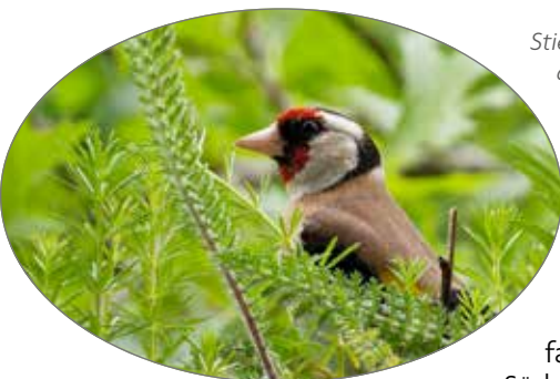
Stieglitze bringen Farbe auf die Obstwiesen

Traditionell war das Braunschweiger Land keine Obstwiesenregion. Der gewerbliche Obstanbau fand und findet mehr in Süddeutschland und im Norden im Alten Land statt.