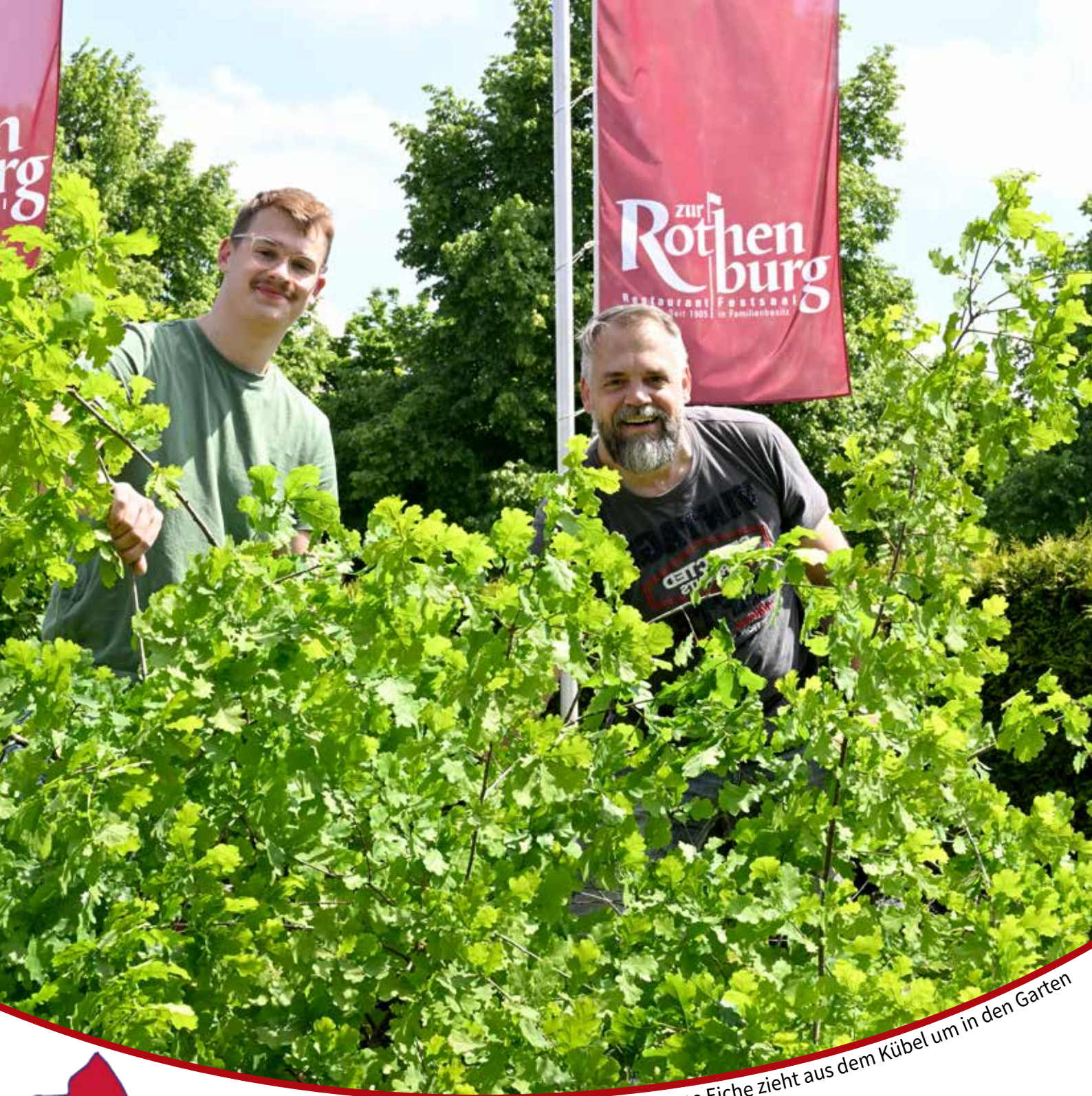
Die selbst gezogene Eiche zieht aus dem Kübel um in den Garten