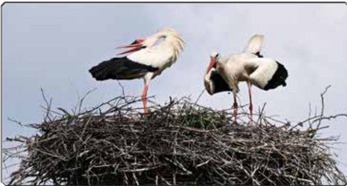
Storchennest bei Broitzem am 12. Mai 2024