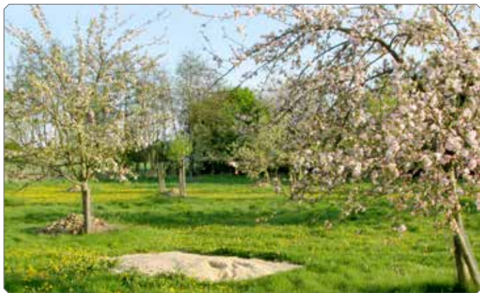
Obstwiesen erfreuen uns mit ihrer Vielfalt, es gibt immer etwas zu entdecken