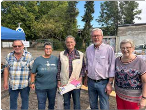
Vorstand der Bürgergemeinschaft Rüningen e.V., der den Dorfflohmarkt hervorragend organisiert hatte