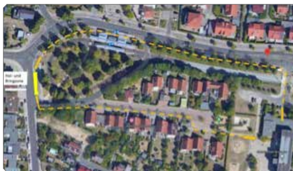
Standort und Beschilderung der Hol- und Bringzone an der Grundschule Broitzem

Leider wird dieses Angebot von nur wenigen Eltern genutzt. Es fahren immer noch zu viele Autos („Elterntaxis“) direkt vor die Schule.